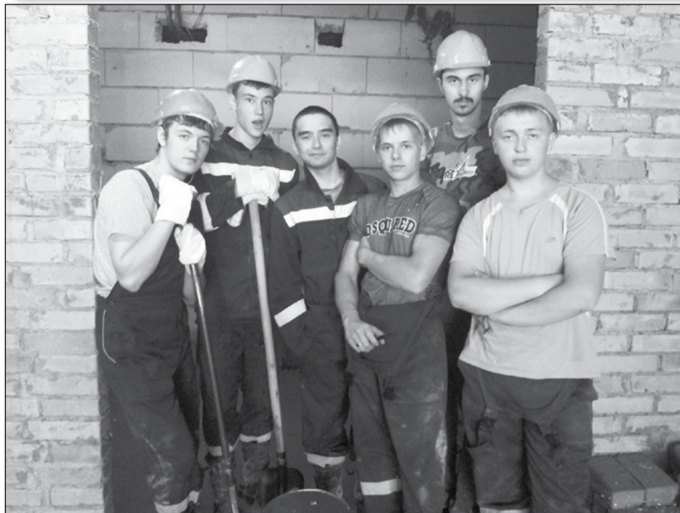
Бойцы «Титана» на студенческой целине-2013. Город Нижневартовск

В российском студенческом отряде насчитывается 230 тысяч бойцов. Более половины из них работают в педагогических отрядах, треть – в стройотрядах, остальные – бойцы отрядов проводников и службы сервиса.