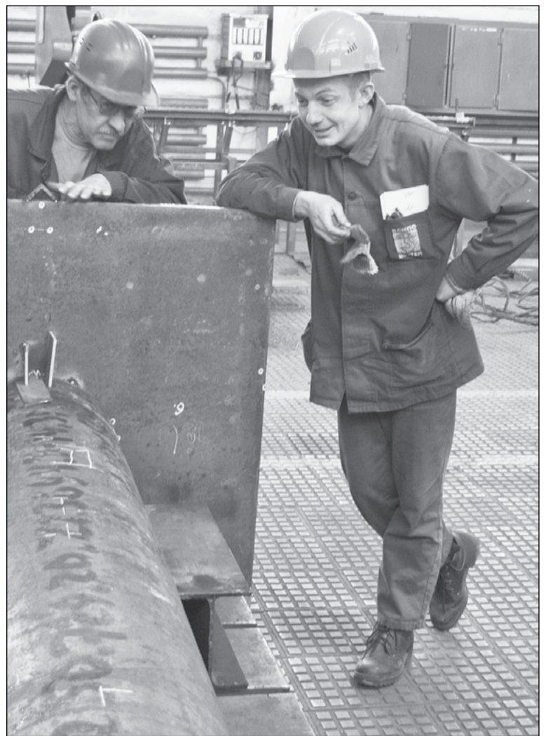
Если в цехе много стружки, подошва должна защищать стопу от возможных проколов. Металлический носок уберёт пальцы, если вдруг на ногу что-то упадёт

Сукну есть альтернатива – современные специальные огнестойкие ткани. К слову, из такой были сшиты два костюма, испытания которых проходили в цехе № 37. Ткань прогорела только тогда, когда сварщик коленом встал на раскалённый металл. Но поставить на поток пошив спецодежды из таких тканей пока не представляется возможным. Почему? Дорого. Тогда, может, внести изменения в «Корпоративные нормы», проанализировав реальный срок годности суконных ко-