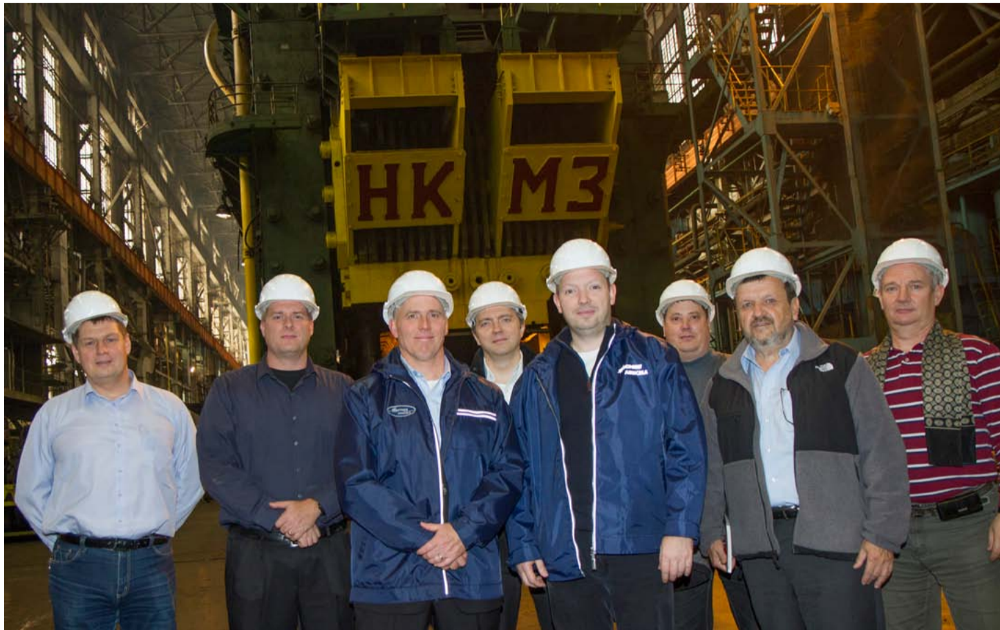
Участники встречи решили сфотографироваться на фоне пресса усилием 75 тысяч тонн, у которого в Самаре есть брат-близнец

Представители АЛКОА не заблудились в цехе № 21