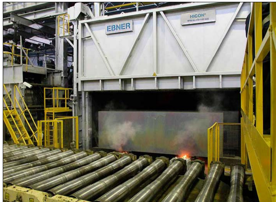
Новая печь для нагрева и гомогенизации алюминиевых слитков, предназначенных для производства баночной ленты

Сегодня «АЛКОА-СМЗ» является крупнейшим в России предприятием по произ-