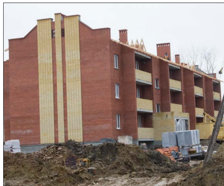
Дом-1 практически готов к новоселью. Дом-2 отстаёт

шем темпе, чтобы уложиться в поставленные перед ними сроки.