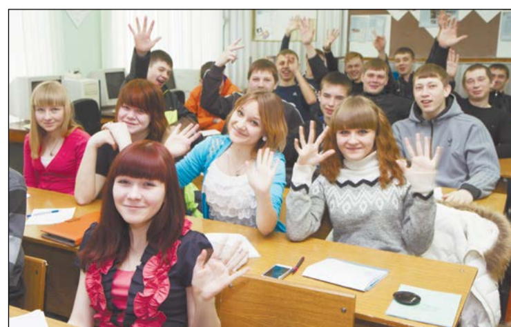
Студенты-электрики рады новым лабораториям