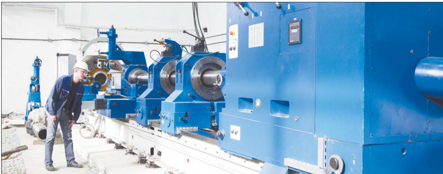
Новый станок глубокого сверления КЖ-19-17-08 удачно прошёл пробные испытания

В цехе № 54 ВСМПО в строй действующих запуском ещё один станок глубокого сверления. В декабре прошлого года он прибыл с Краматорского завода и тут же попал в руки монтажников, а в феврале 2014-го на нём уже было произведено пробное сверление штамповок. Новый станок – 43-я единица оборудования цеха по механической обработке. Оборудование приобретено по инвестиционному плану развития цеха, в котором прописано увеличение станочного парка до 2017 года.