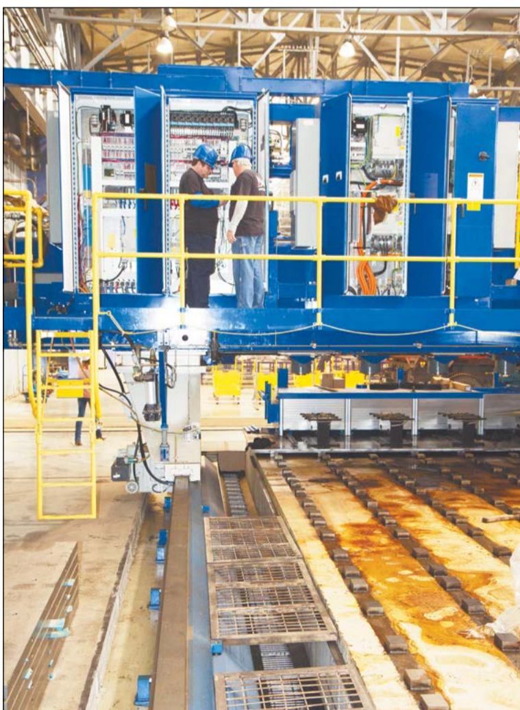
В июне оживут все порталы четырёх- и пятишпиндельных Cincinnati