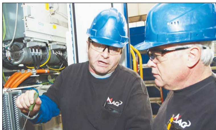
Американские специалисты установили свои станки в 20 странах