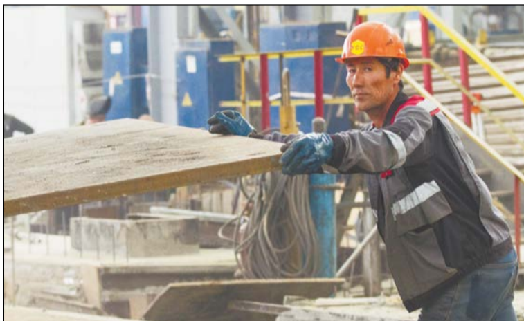
Стальные плиты толщиной 50 мм превращаются в прочные полы

На другом, не менее важном, чем пресс-4000, объекте цеха № 22 – на кольцераскатной линии работы ведут строители УКСа. До середины октября им нужно закончить с тремя фундаментами: под пресс-8000, кольцераскатную линию и экспандер.