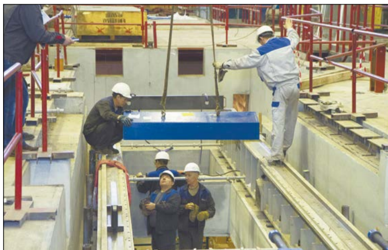
Точная установка основания стана – залог успеха последующего монтажа