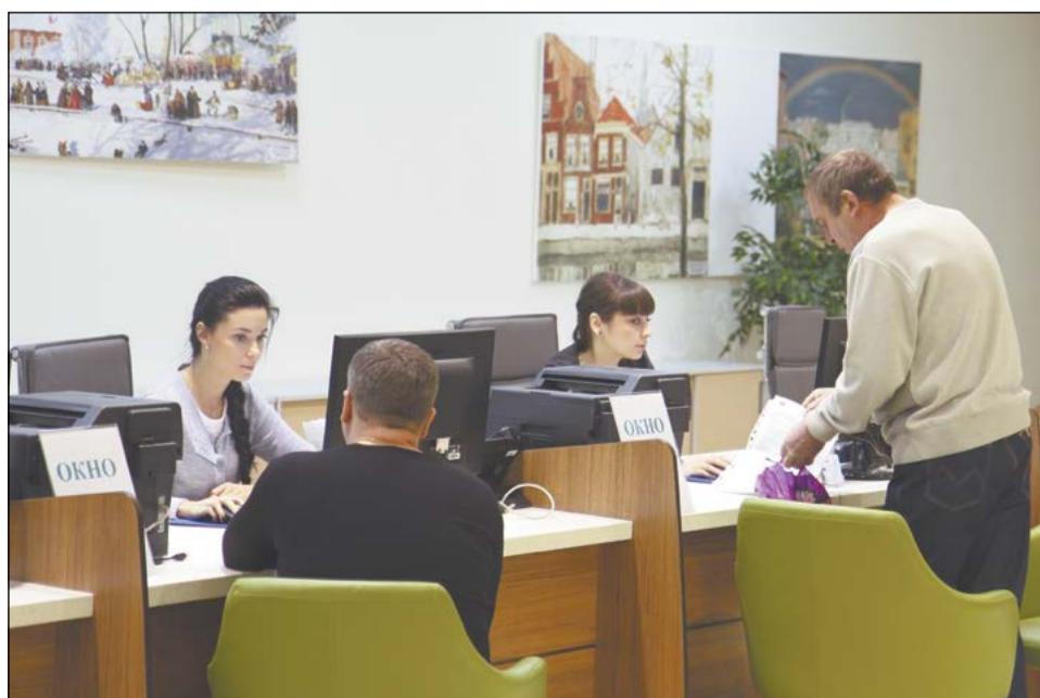
Записаться на приём – без проблем