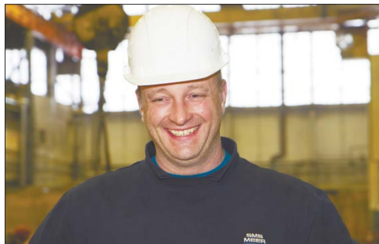
По мнению Штефана Грютцнера, монтаж ведётся на хорошем уровне