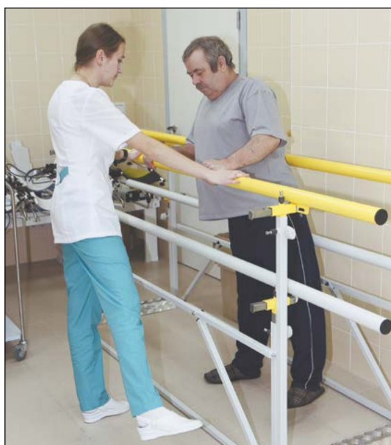
Кинезитерапия – № 1 после операции