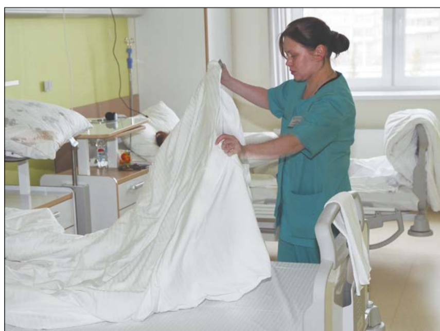
В палатах всё на высшем уровне