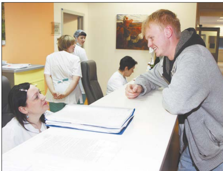
На медицинском посту – с улыбками