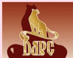
Вятская Меховая Фабрика г. Киров

Верхняя Салда / 25 декабря / с 10 до 18 ч. Кинотеатр «Кедр», ул. Энгельса, 38