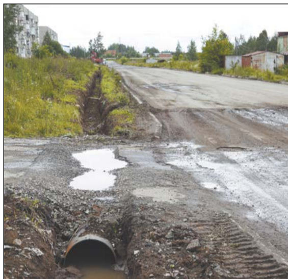
Улица Устинова в ожидании ремонта, контракт на который подписан в мае