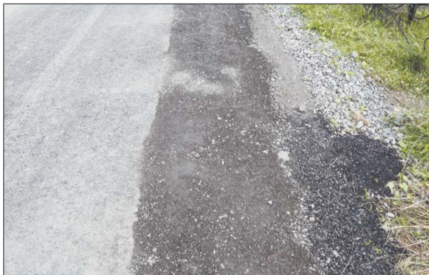
Салдинцы рассчитывали на более качественное асфальтирование центральной дороги кладбища

Лето в разгаре, чего нельзя сказать о ремонте дорог в Верхней Салде. Тагильские фирмы, выигравшие муниципальные контракты на ремонт дорог, в том числе и капитальный, заканчивать работы пока не торопятся. Например, из 18 дворовых территорий благоустроены пока только дворы домов № 2, 4 и 19 по улице Восточной. Хотя контрактом предусмотрено выполнение всех работ до 30 июня.