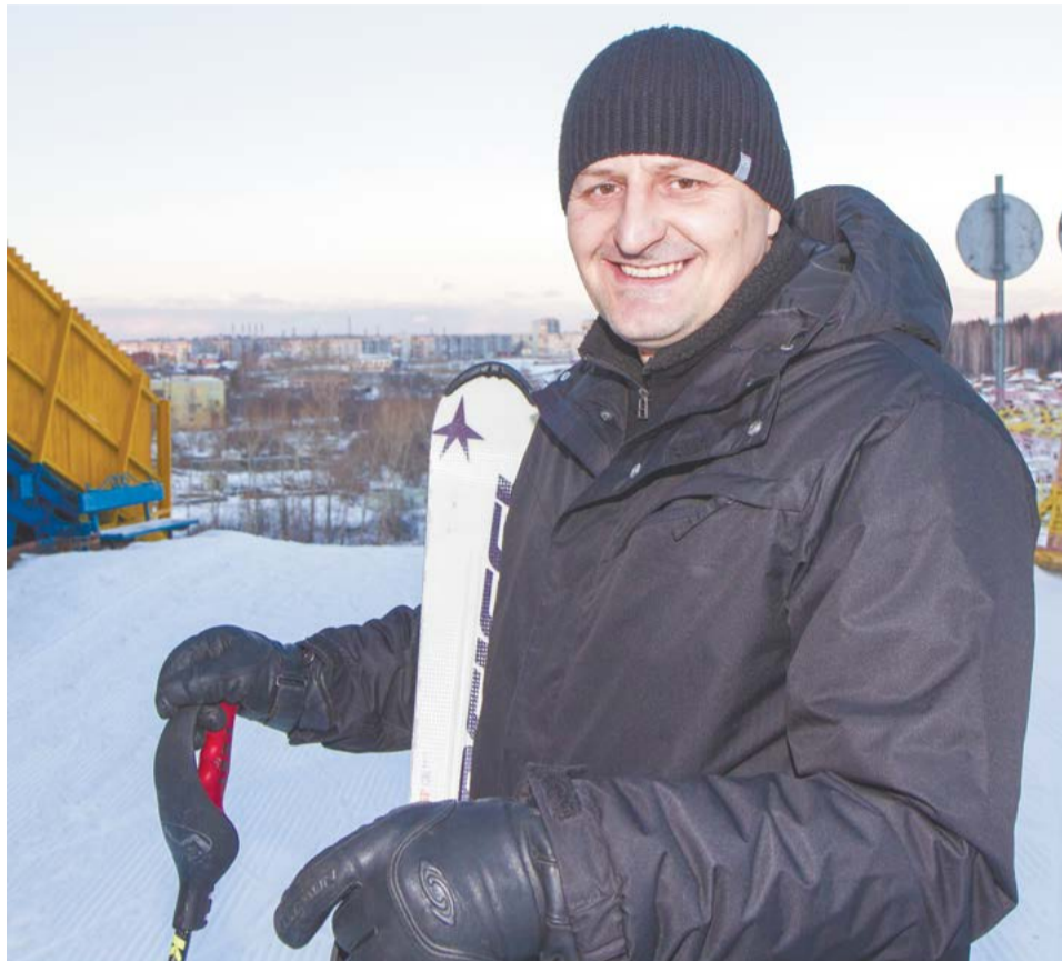
Победитель чемпионата России по горным лыжам делится опытом с салдинскими спортсменами

Увидеть под собой снежный склон, оттолкнуться и нырнуть вниз, рассекая ветер, наслаждаясь чувством свободы,