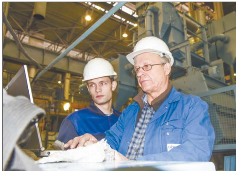
Специалисты Wheelabrator следят за точностью настройки нового оборудования