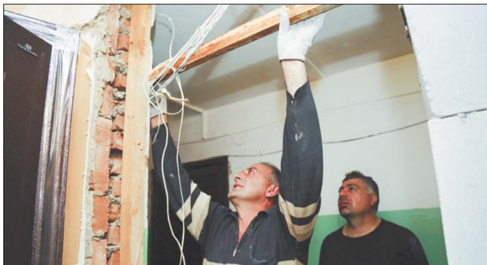
Строители фирмы «Виктория» восстанавливают жильё в рекордные сроки