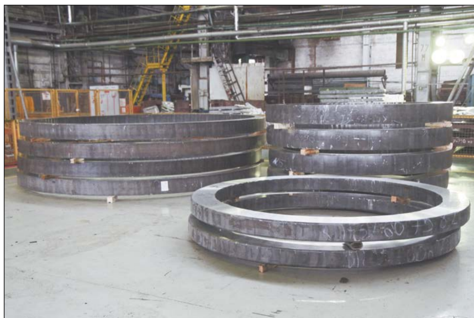
Эксклюзивная монолитная продукция – бандажные кольца для ракет