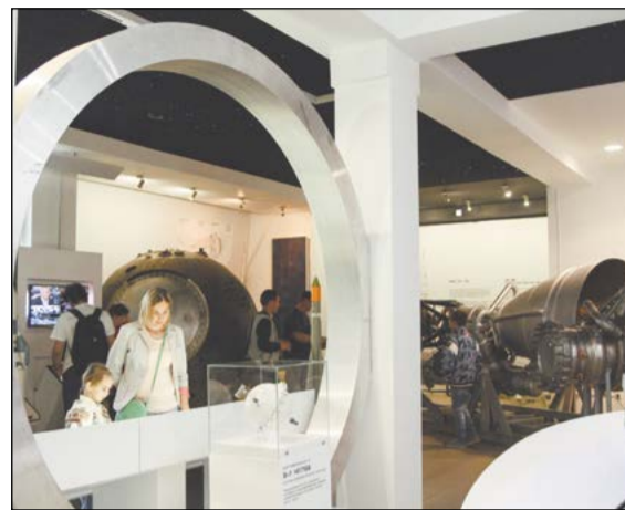
В музее «Самара космическая» всегда много посетителей

на горячие бойки, зато заверили, что и яйцо катали, и будильник выключали.