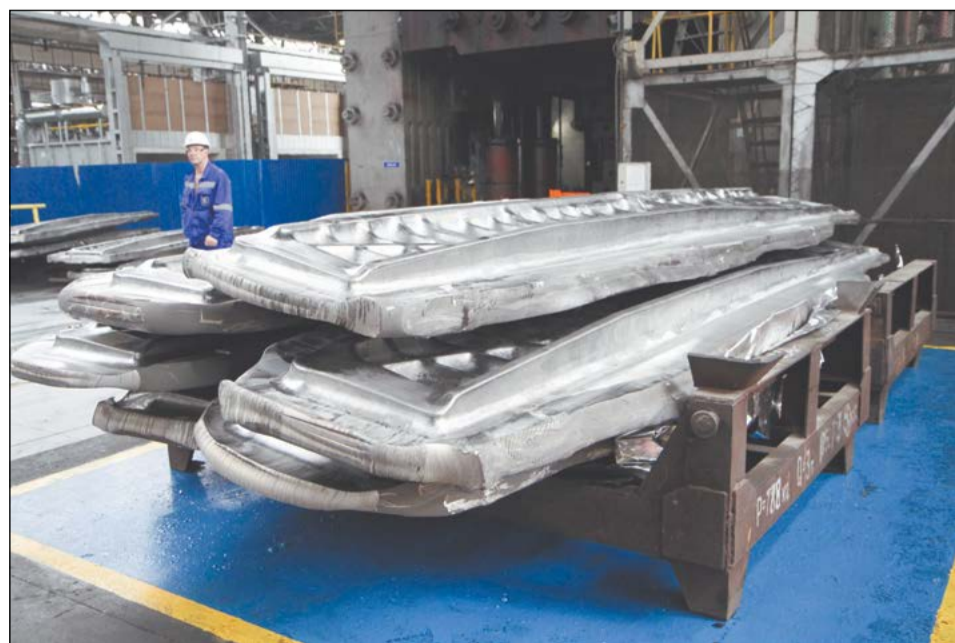
Только что отштампованная на «семидесятке» заготовка