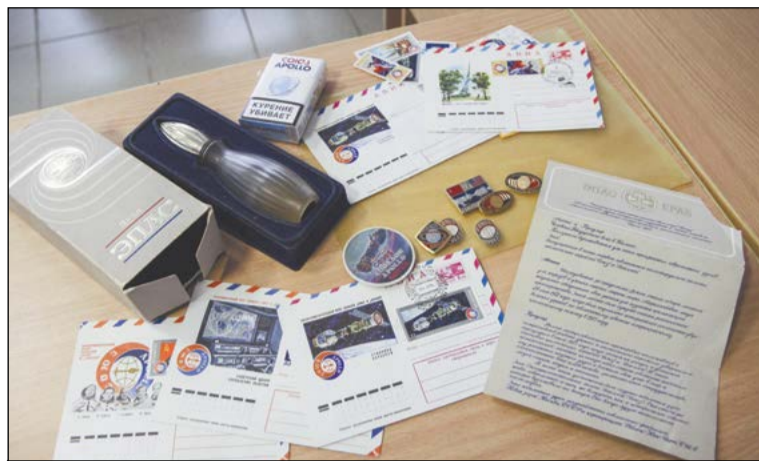
Экспонатам, выпущенным в ознаменование экспериментального полёта «Союз-Аполлон», уже 40 лет