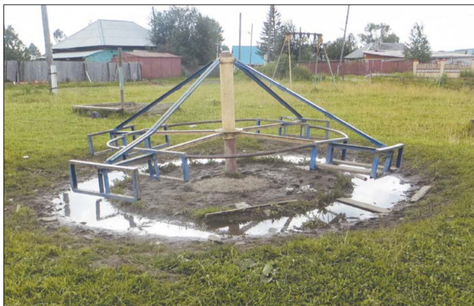
У конструкции на Малом Мысу ничего общего с детской каруселью

Вот и лето прошло, словно и не бывало. Хотя, конечно, в запасе календаря ещё 31 день августа, но в контексте летнего благоустройства они уже мало что значат. «За месяц ещё много чего можно сделать!» – возможно, не согласятся многие читатели, особенно те, кто отвечает за самое благоустройство. Можно-то можно, да кому уже это будет нужно?