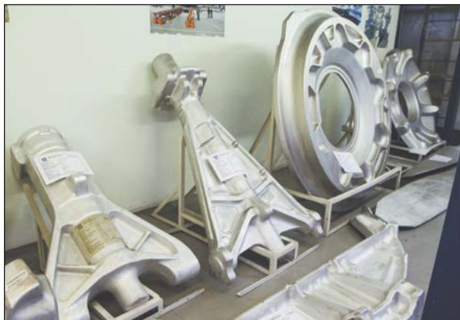
Алюминиевая продукция Самарского металлургического завода – сложноконтурные штамповки