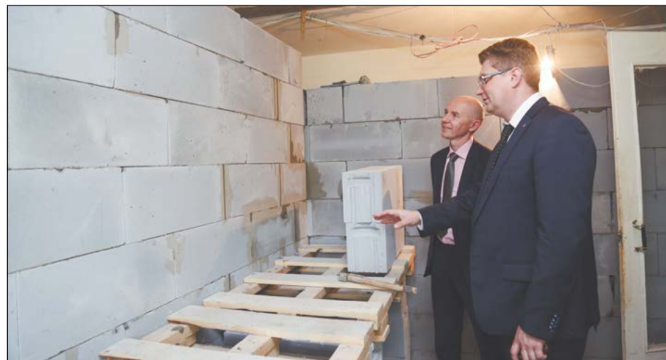
Главы округа ежедневно отслеживают ход ремонта разрушенных квартир