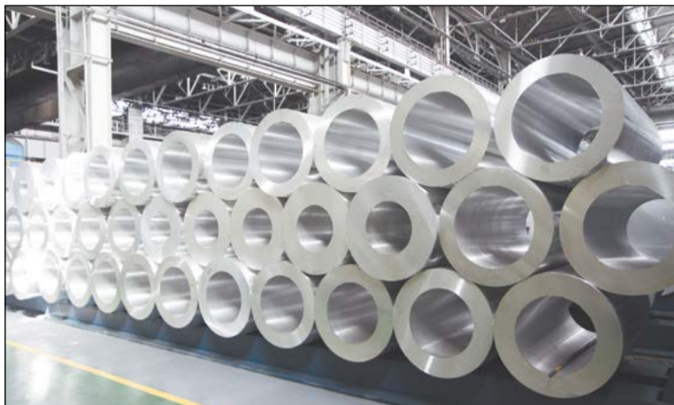
Полые слитки разрезают и превращают их в панели для авиации и судостроения