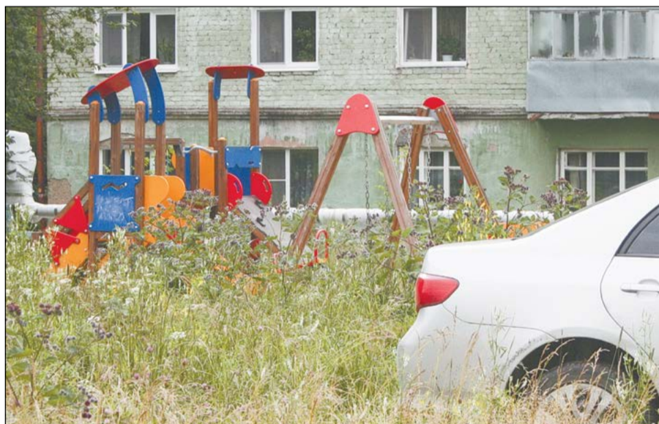
Детскую площадку у школы № 3 не видно в зарослях репейника