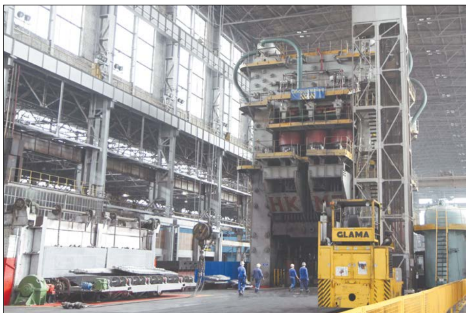
В кузнечно-прессовом цехе много окон, очень светло и пресс, выкрашенный в серый цвет, смотрится совсем по-другому

Очень жаль, но съёмочной группе не удалось запечатлеть в работе «семидесятку», которая к нашему приходу закончила штамповать полуфабрикаты для обновлённого Ил-476. Пресс был модернизирован в 2008 году и в отличие от нашего зелёного, выкрашен в серый цвет. Раз в месяц он останавливается на планово-предупредительный ремонт. Мы попросили показать мастер-класс, закрыть прессом спичечный коробок, но кузнецы отказались, сославшись