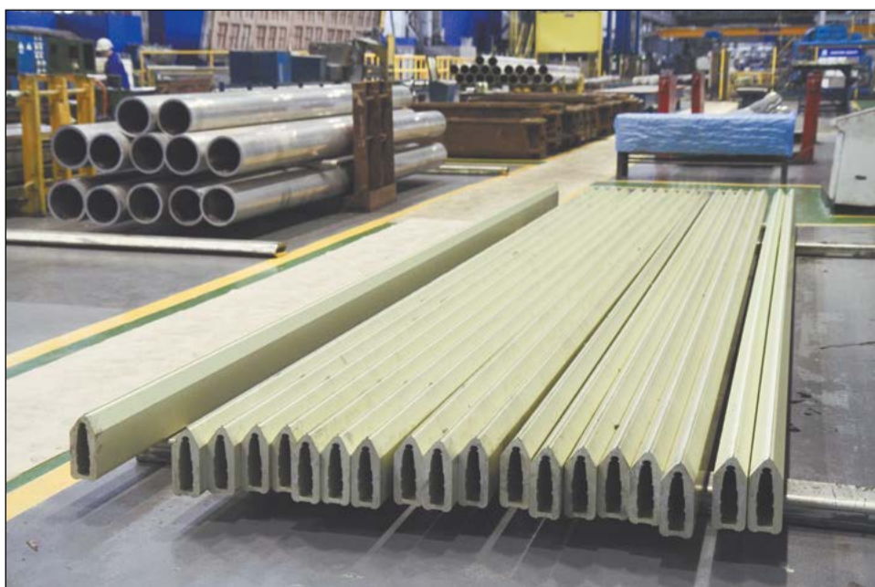
Профиль для лопастей вертолёта

Продолжение в следующем номере Наталья КОЛЕСНИЧЕНКО