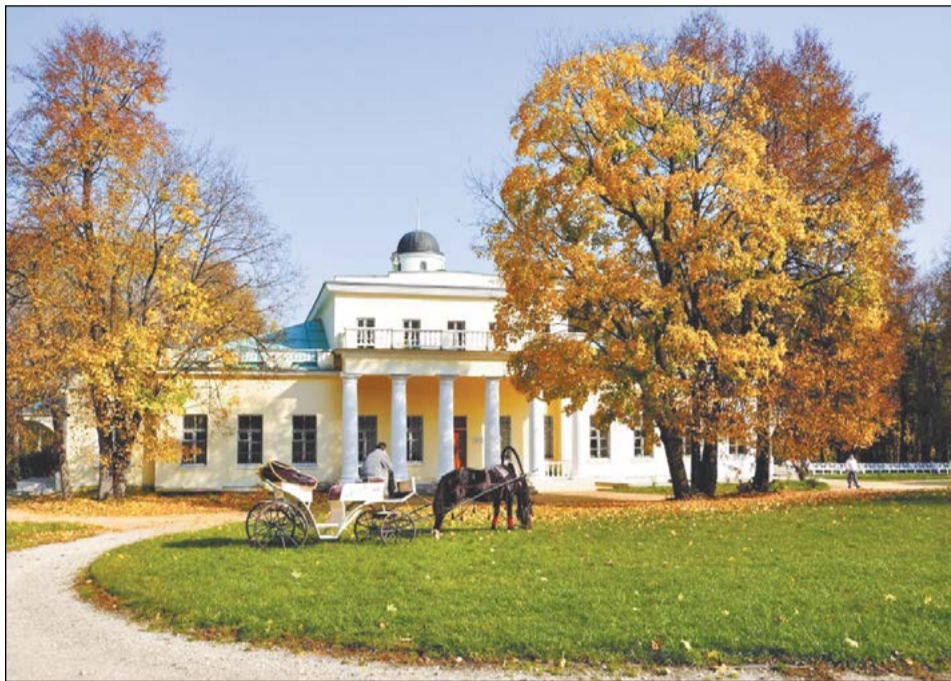
Усадьба Фёдора Тютчева. Село Овстуг Брянской области

Во-вторых, изменилось поведение большинства игроков туроператорского рынка.