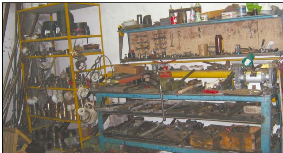
Было и стало. На участке цеха № 37 теперь идеальный порядок

В цехах ВСМПО ищут новые способы внедрения инструментов бережливого производства