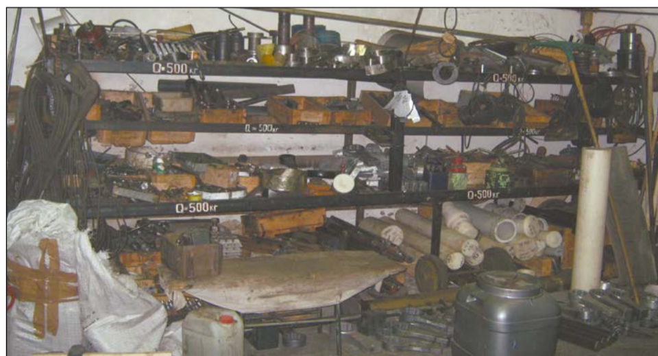
Самодельный стеллаж вместо бардака: и красиво, и удобно, и практично

Совместный рейд пресс-службы ВСМПО и дирекции по повышению операционной эффективности превратился в приятную экскурсию, главными экспонатами которой стали участки образцового содержания, а гидами – люди образцового понимания необходимости рациональной организации производства и у которых не возникает вопроса что где валяется и когда всё это кончится.