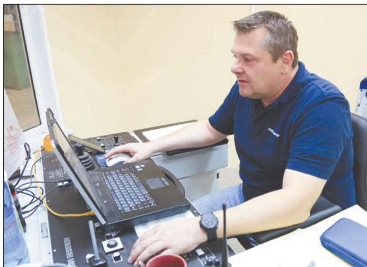
Для каждого элемента кольцевараскатного комплекса – свой персональный немецкий наладчик