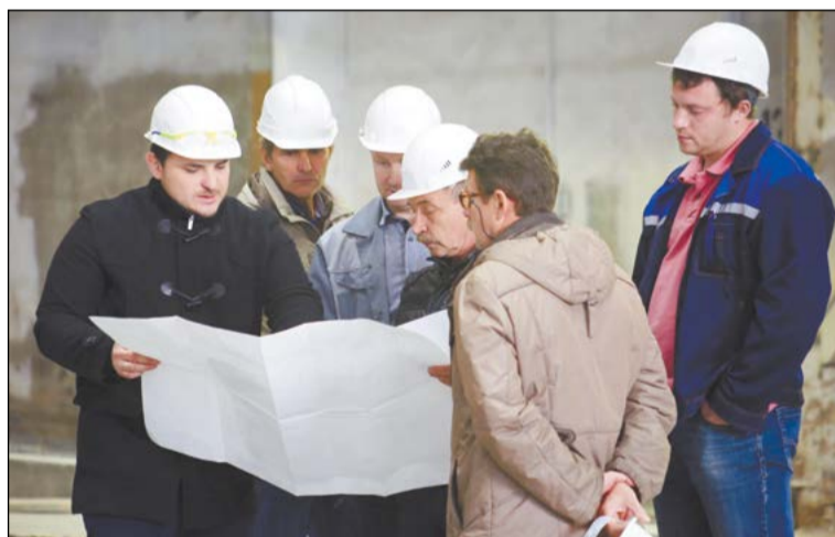
Важно не только выстроить нагревательные печи, но и оптимально верно уложить полы вокруг них