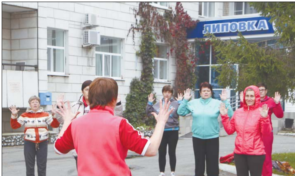
Ежедневная дыхательная гимнастика по Стрельниковой

«Липовка» превращает опасный радон в чудодейственное средство