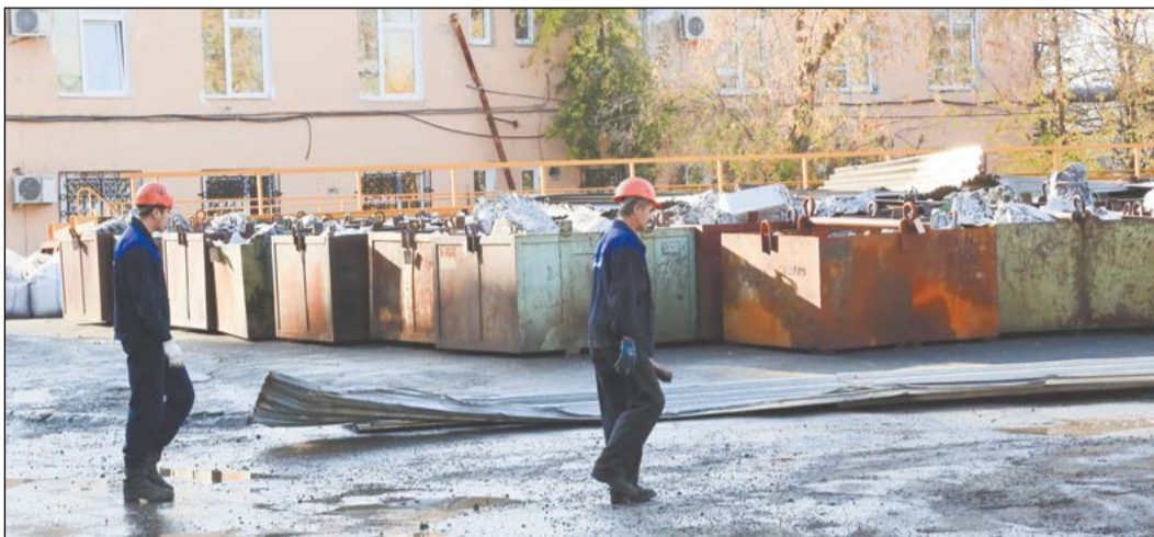
Пока алюминиевые отходы хранятся под открытым небом

Новому корпусу цеха № 22 очень обрадуется коллектив цеха № 1