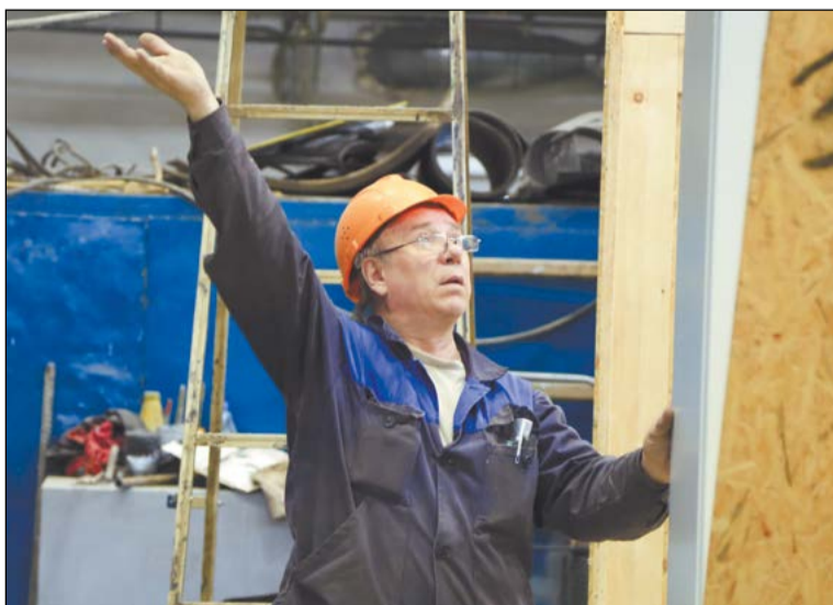
Любому оборудованию, прибывающему на участок, определено место и точка приземления