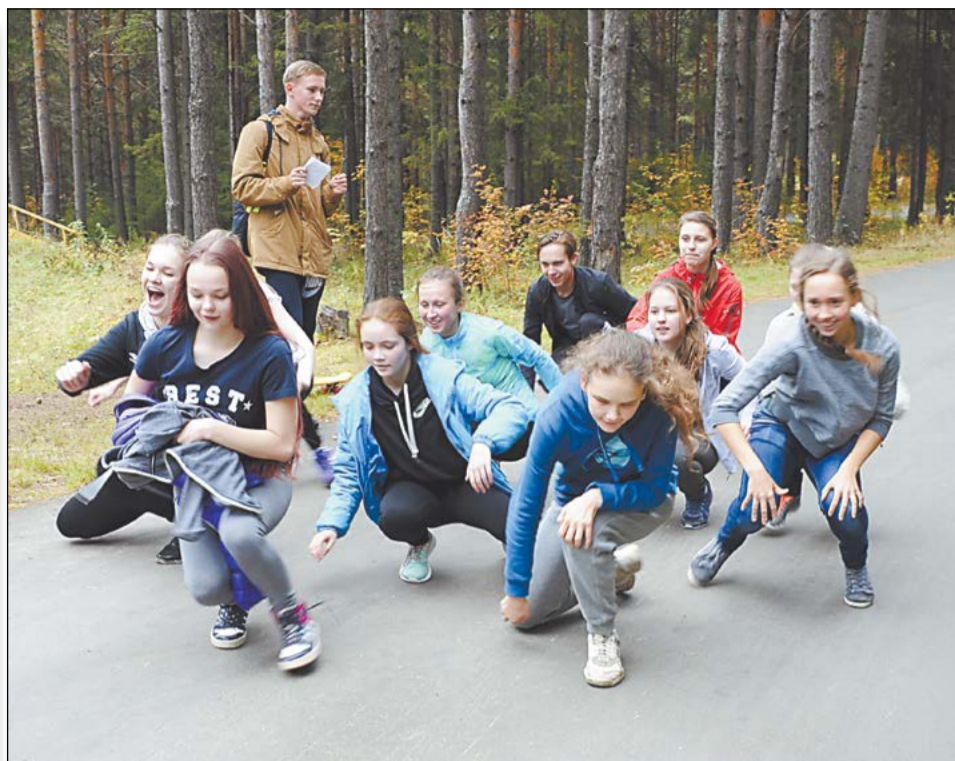
На финише олимпийского забега школы № 1 задание усложнилось, но командный дух помог справиться