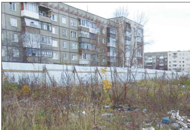
Там, где рос бурьян и размещались гаражи-«нелегалы», начинается строительство жилого комплекса