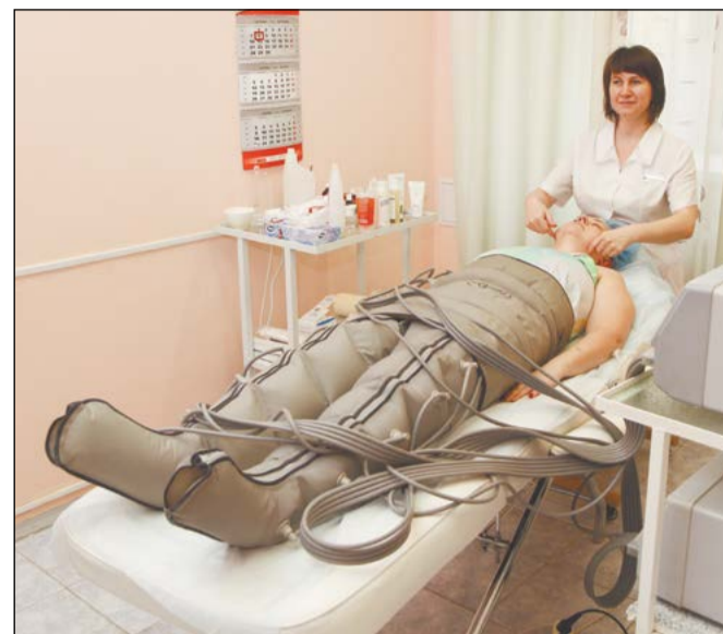
И прессотерапия, и массаж лица одновременно

– В Первоуральске мужу оказали помощь и перевели в Екатеринбург, где пролечили две недели и опять – в Первоуральск, а потом уже направили сюда. Очень нравится, персонал замечательный, отзывы напишем положительные. Муж ещё не говорит, но уже улыбается и почти разработал руку, может сам держать кусочек хлеба.