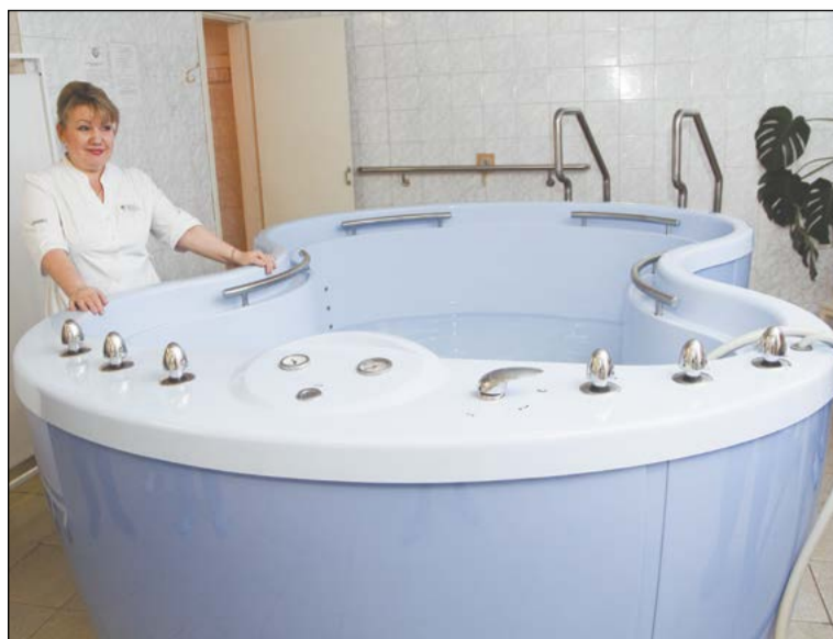
Ванна Губбарда в форме бабочки предназначена для массажа всего тела