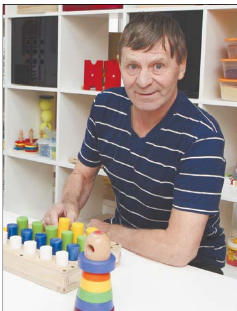
Люди после инсульта здесь быстро идут на поправку