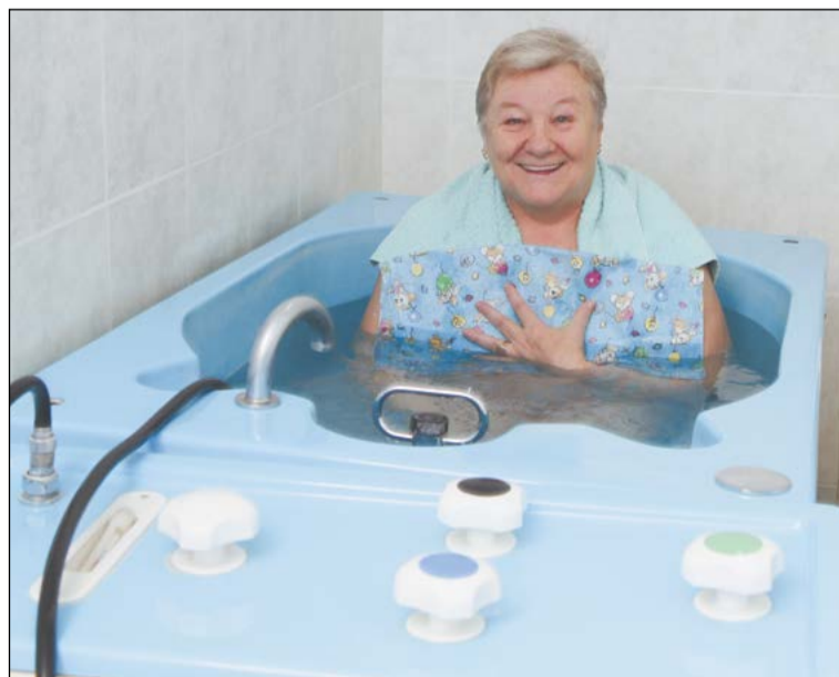
В вихревых радоновых ваннах можно только улыбаться