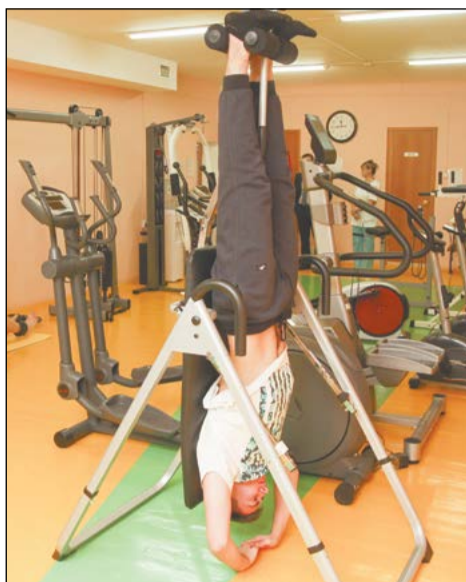
Вверх ногами – тоже полезно