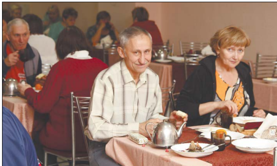
Завтрак в столовой – в три смены, питание четырёхразовое

Село Липовское находится в 15 километрах от Режа. Из Салды ехать часа два с половиной. Испокон веков местные жители занимались здесь земледелием и время от времени находили где-нибудь в борозде россыпи разноцветных камешков – цитрины, аметисты, кварцы. Это никого не удивляло, в уральской земле много богатств!