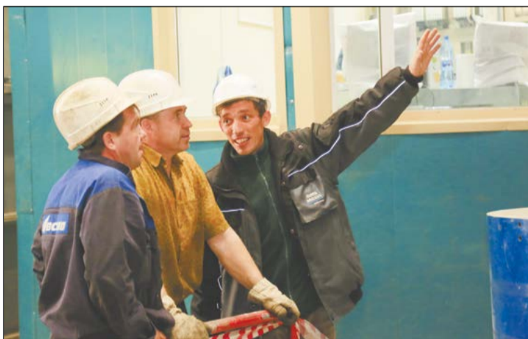
Монтажники цеха № 50 – первые помощники зарубежных специалистов в ходе пусконаладки