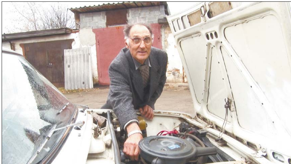
Под капотом рвут с места 69 «лошадей»