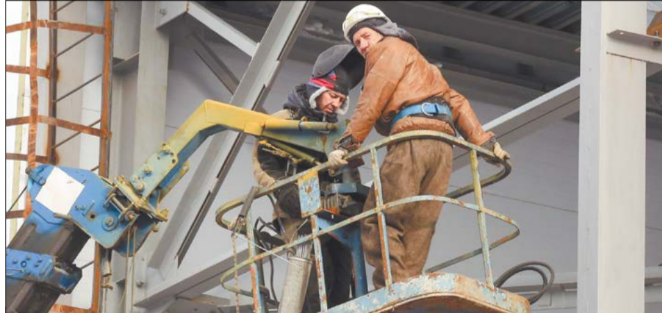
Завершается монтаж металлического каркаса крыши

Где только ни побывал! Но всё же вернулся в родную Верхнюю Салду. И, устроившись в управление капитально-