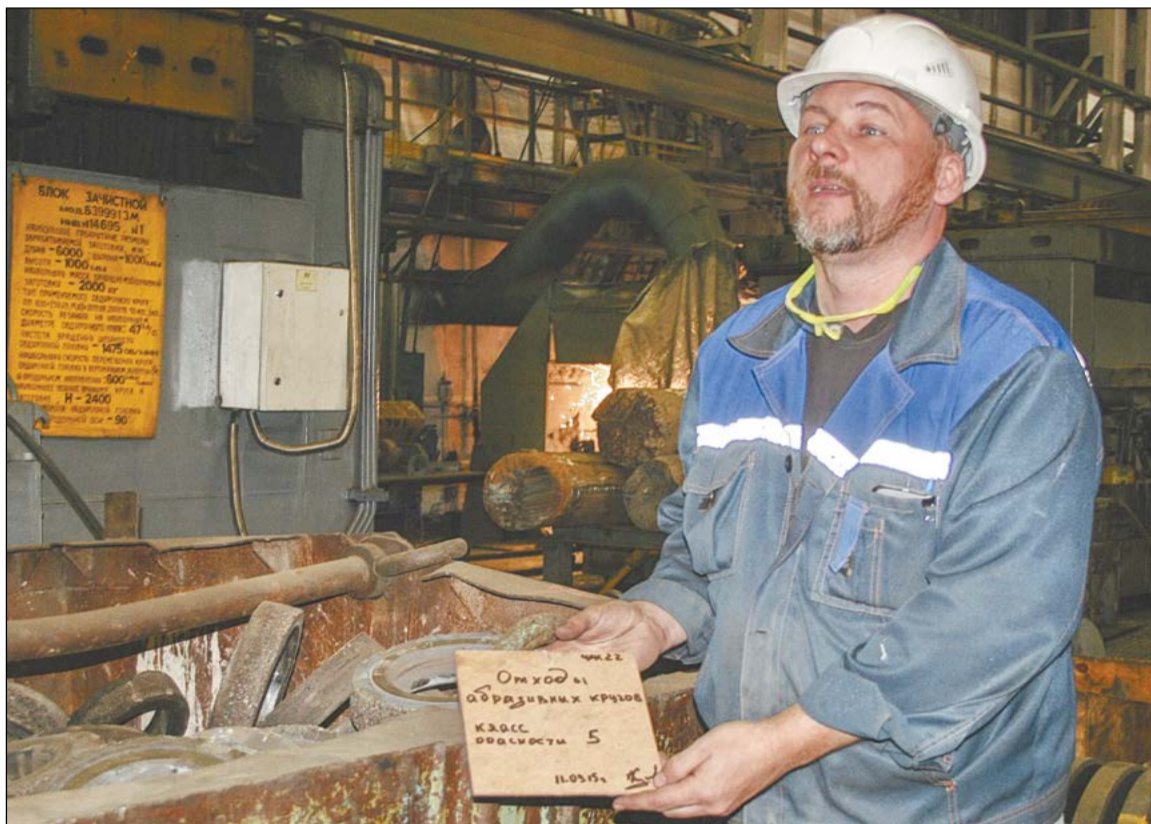
Каждый ящик с отходами в цехе № 22 соответственно промаркирован

Он ведёт нас мимо промаркированных контейнеров со стружкой (этот отход, к слову, идёт в переработку), с отработанными абразивными кругами – всё подписано, рас-