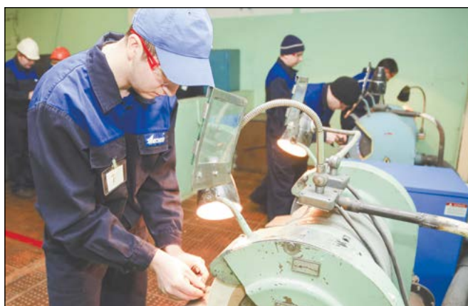
Всё начинается с универсального станка