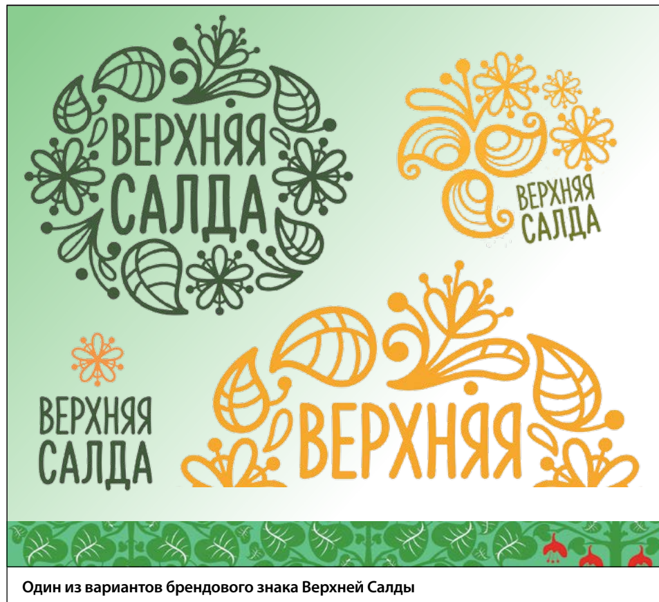
Один из вариантов брендового знака Верхней Салды