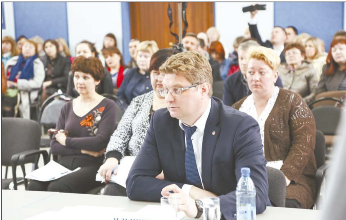
К 10 мая в Думу поступило 74 уведомления о присутствии на заседании. При открытии заседания – в 8.15 в зале находилось 56 человек. В основном это были сотрудники учреждений культуры

Во-первых, в сферах образования и культуры действуют законы о дорожных картах, не позволяющие опускать заработную плату ниже определённых уровней, а во-вторых, Бюджетный кодекс предполагает финансирование по нормативам, исходя из наличия объектов.