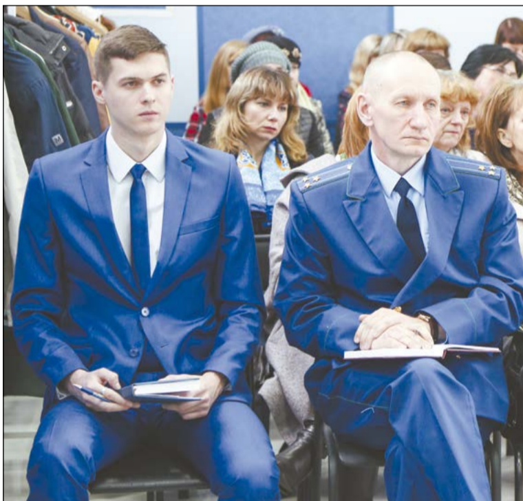
Голосование проходило под наблюдением представителей Верхнесалдинской городской прокуратуры