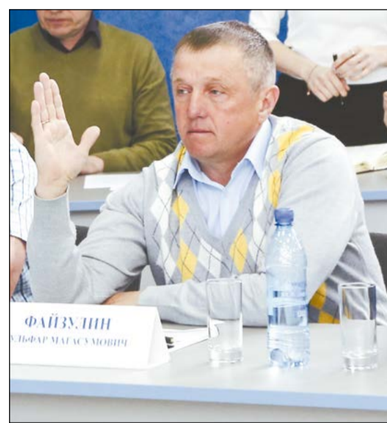
Из 15-ти присутствующих на заседании Думы депутатов 14 проголосовали за изменение Устава