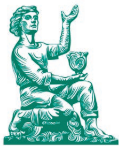
Уральский клинический лечебно-реабилитационный центр