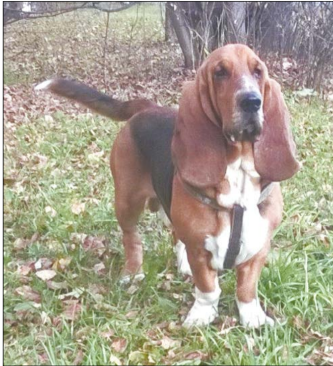
Внимательно слежу за дорогой, хозяйку с работы я жду