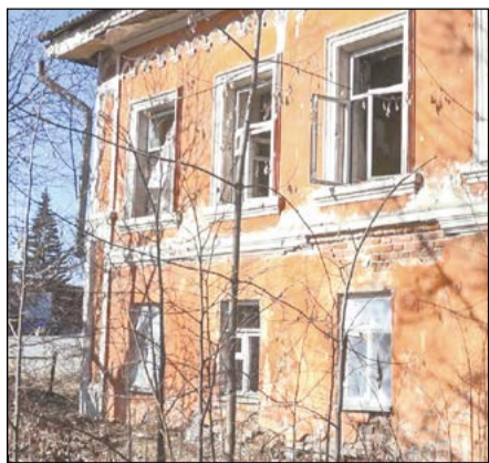
Из этого здания в 2003 году Верхнесалдинский суд переехал по новому адресу

Некоторые стены, перекрытия, участки кровли признаны ограниченно работоспособными, но есть элементы сооружения, которые не подлежат дальнейшей эксплуатации. Решение о дальнейшем использовании здания или его сносе должна принять межведомственная комиссия, созданная при правительстве Свердловской области.