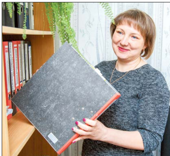
Под контролем юриста Любови Головановой документы Социально-реабилитационного центра