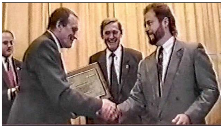
Стоп-кадр из видеоархива телевидения ВСМПО. 1993 год. Вручение первого международного сертификата

9 июля в Верхнюю Салду прибыли специалисты фирмы «ТЮФ Интернациональ Рус», чтобы поздравить ВСМПО с 25-летием со дня получения первого сертификата, подтвердившего соответствие системы качества ВСМПО высочайшим требованиям международного стандарта.