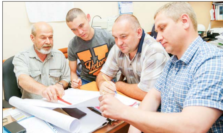
Совещание гидравликов и специалистов по планированию ремонтов