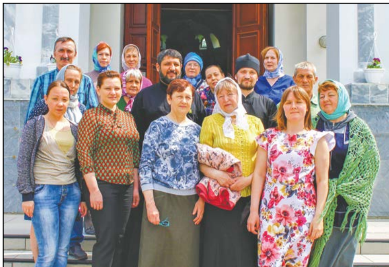
Участники верхнесалдинского общества «Трезвение»

По данным Роспотребнадзора, количество алкоголиков