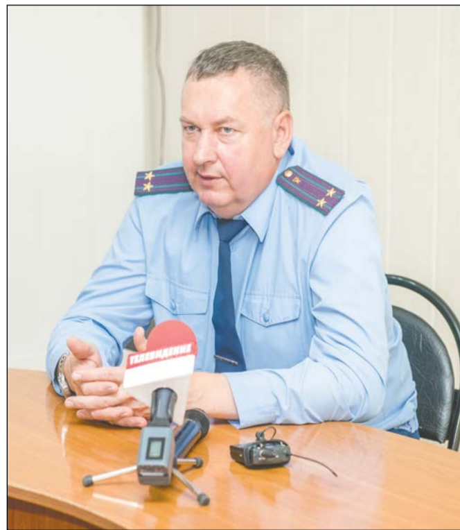
Основным спикером на пресс-конференции был заместитель прокурора города Святослав Балясный