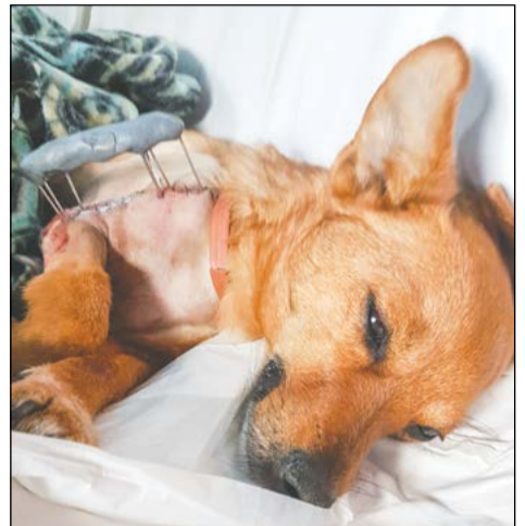
Дину лечили полгода