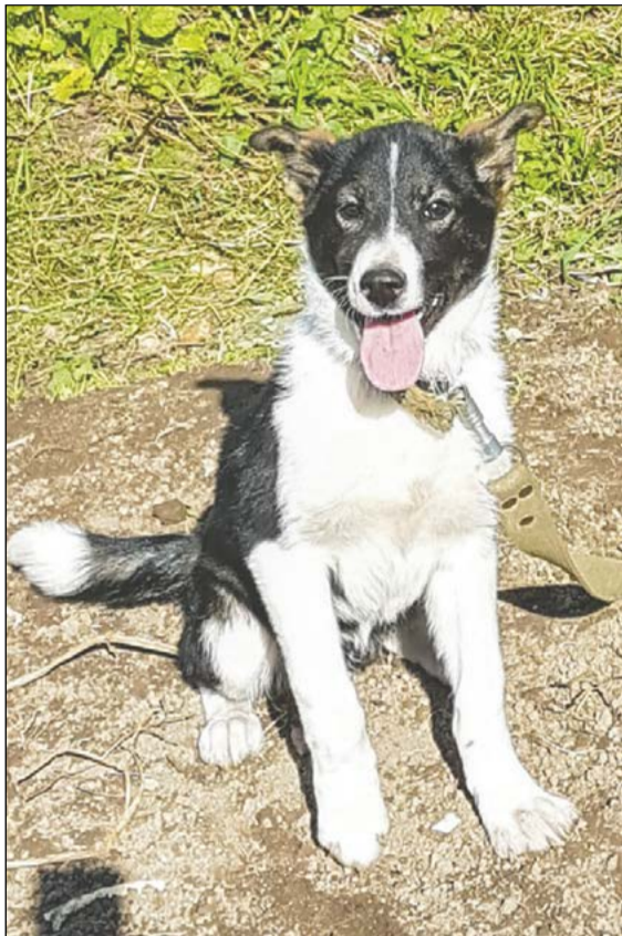
Эти милахи ждут своих хозяев. Обращайтесь по телефону 9527420146 или в группу ВКонтakte https://vk.com/club166824279