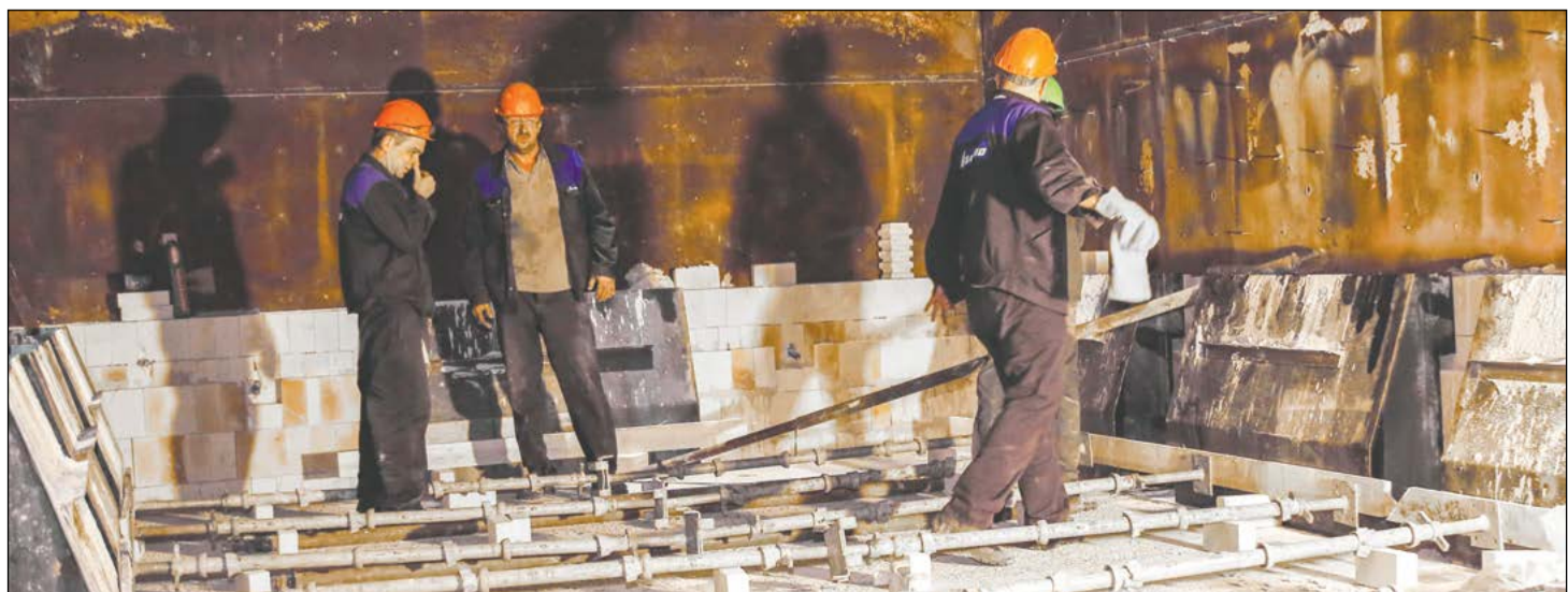
Бригада цеха № 49 проводит капитальный ремонт немецкой печи «Лёхер» № 23