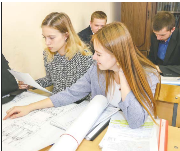
Подготовка к защите в самом разгаре