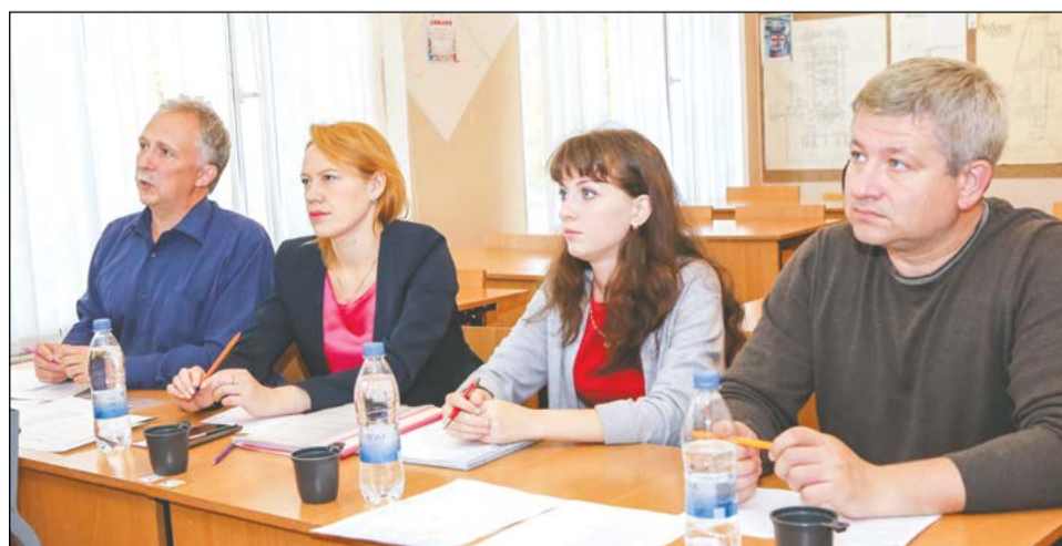
Впервые вместе с педагогами курсовые работы оценивают инженеры ВСМПО