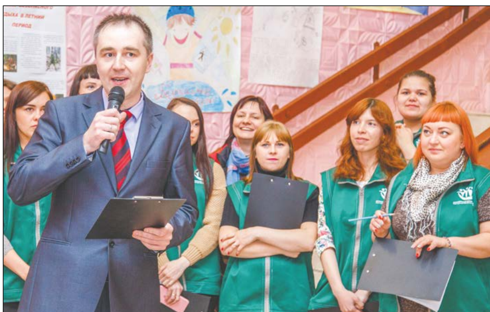
Когда за спиной такие боевые девчонки – любое дело по плечу