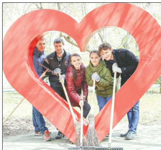
С любовью от молодёжки ВСМПО