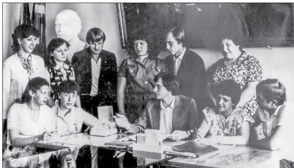
Комсорги цехов ВСМПО. Фото 1983 года