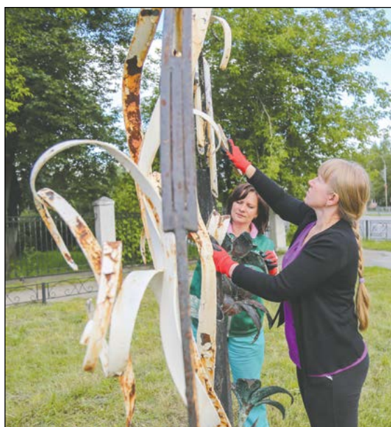
Молодёжи ВСМПО есть дело до всего