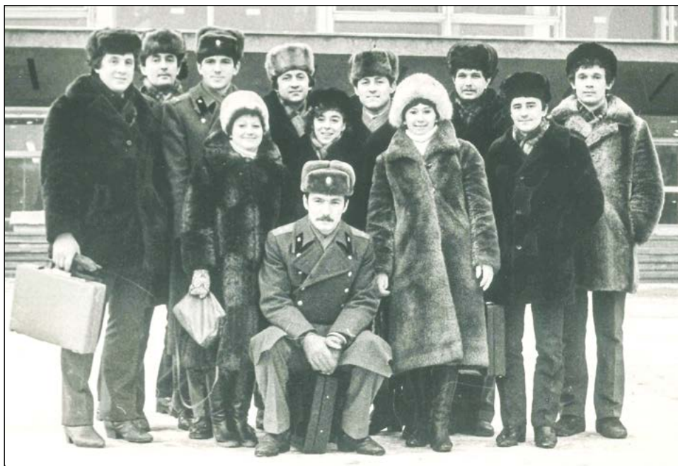
Делегация Верхней Салды на областной комсомольской конференции. 1985 год