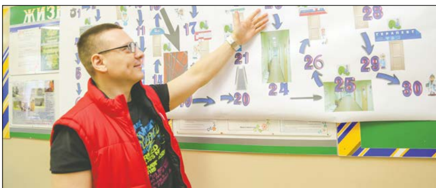
Молодёжные лидеры цехов ВСМПО за любой кипиш, кроме голодовки