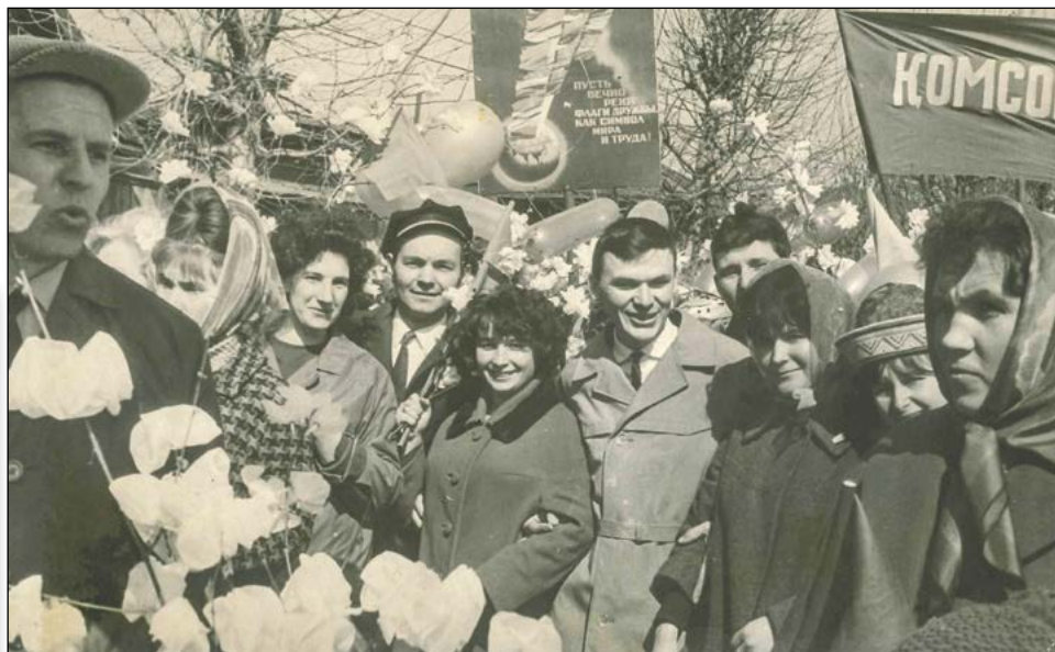
Комсомольцы цеха № 35 на первомайской демонстрации. 60-е годы

В конце вечера жюри определило победителей, которые получили путёвки на городской конкурс чтецов.