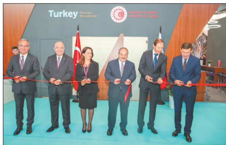
Открытие экспозиции Турецкой Республики – страны-партнёра ИННОПРОМа-2019