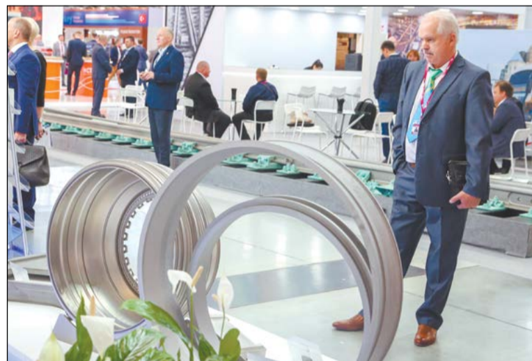
Глубокая мехобработка титановых изделий ВСМПО сосредотачивала интерес посетителей