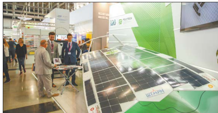
Новинка питерского политеха – экраноплан, который питается солнечной энергией и развивает скорость до 70 километров в час