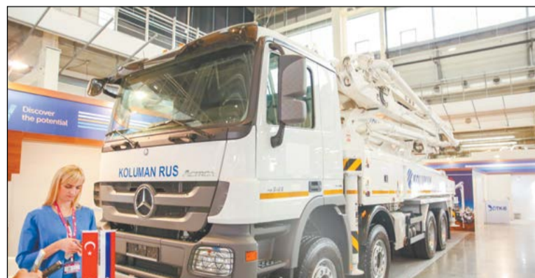
Автомобилестроительный холдинг Koluman представил универсальный бетононасос