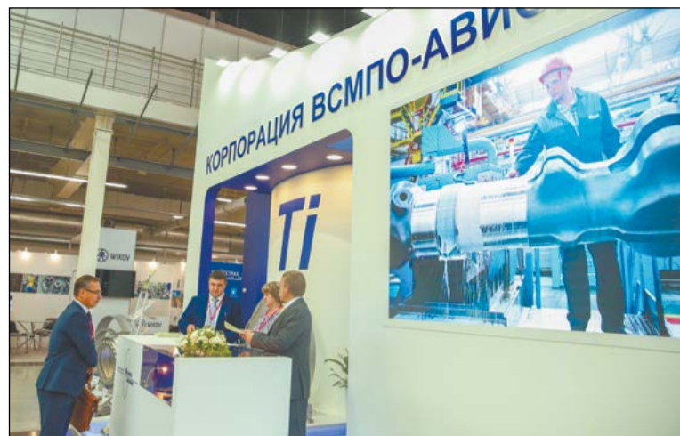
На стенде ВСМПО проходили десятки важных встреч и обсуждений новых проектов