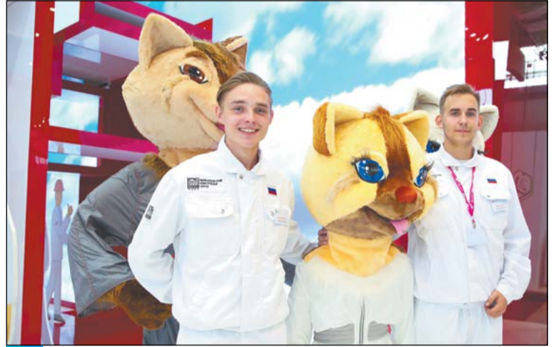
Ростовые куклы олицетворяли ЧТПЗ как компанию белой (чистой) металлургии

В 10-й раз Екатеринбург провёл международную промышленную выставку ИННОПРОМ. В огромных павильонах выставочного центра «Екатеринбург-ЕХРО» тысячи участников предлагали свои новинки передовых разработок в сфере промышленности и технологий. Сквозная тема выставки – цифровизация, страной-партнёром на юбилейном индустриальном форуме России стала Турецкая Республика.