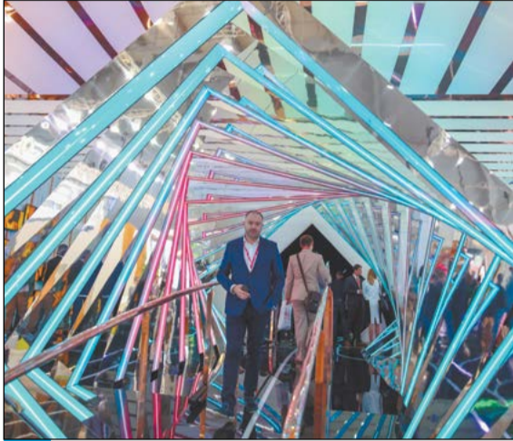
Самым зрелищным и высокотехнологичным был стенд Русской Медной Компании