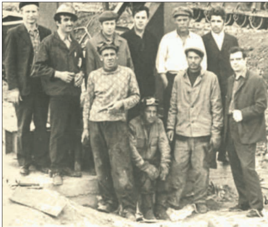
17 июня 1972 года. У первой колонны корпуса