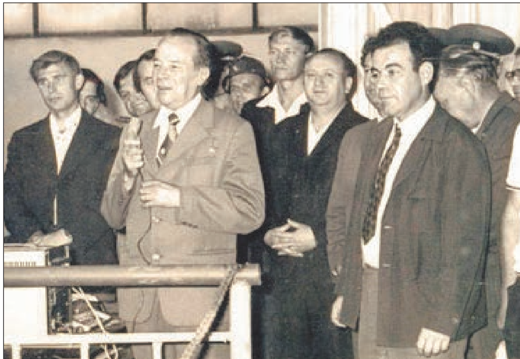
15 июня 1977 года. Торжественный митинг в цехе, посвящённый вводу цеха № 18 в строй действующих