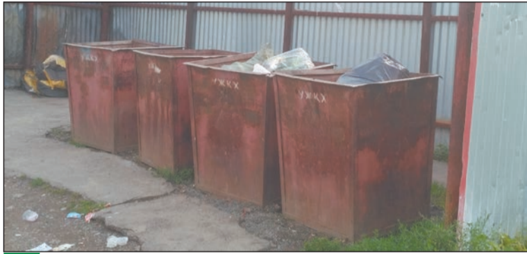
До конца октября такие железные баки будут заменены на современные ёмкости европейского стандарта

Так, после проведённого анализа в «Рифей» подана заявка на поставку 110 новых контейнеров, 63 из них уже предоставлены региональным оператором. Это современные пластиковые баки с крышкой и на колёсах, предназначенные для мусоровозов с задней загрузкой. В машину их можно закатить, а не ссыпать с высоты разлетающийся мусор.