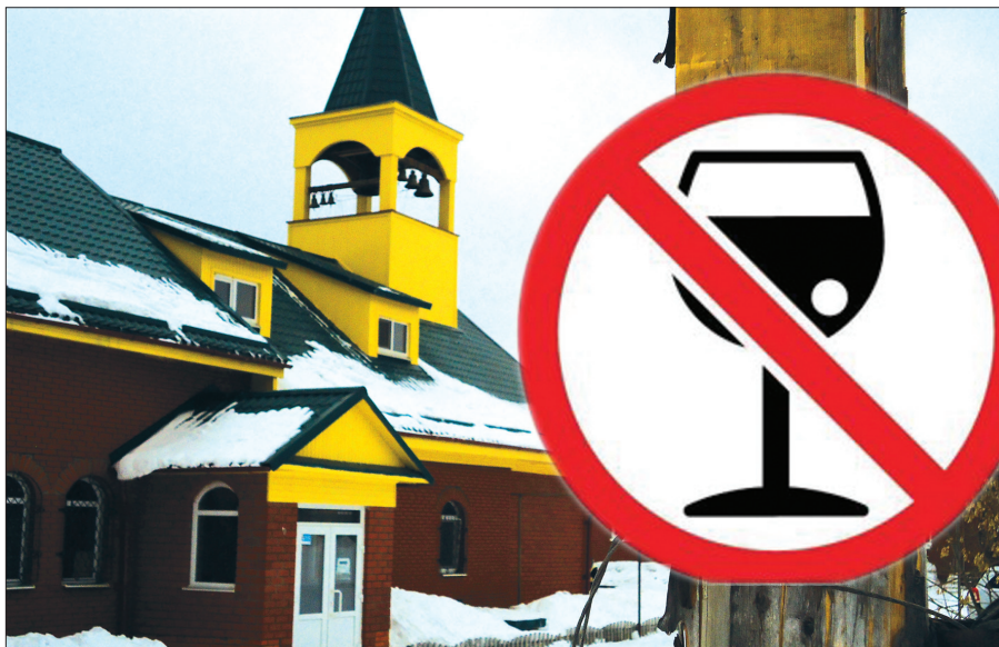
Акафист перед иконой читают в храме каждый понедельник в 17 часов