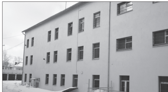
Павел Никифоров Фото автора

По словам полицейских, в апреле в суд будут переданы 15 уголовных дел, возбужденных по статье 158 УК РФ «кража».