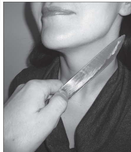
Павел Никифоров Фото автор

По данному факту возбуждено уголовное дело по части 2 статьи 162 УК РФ «разбой», санкция по которой предусматривает до семи лет лишения свободы. В настоящее время подозреваемый находится под арестом.