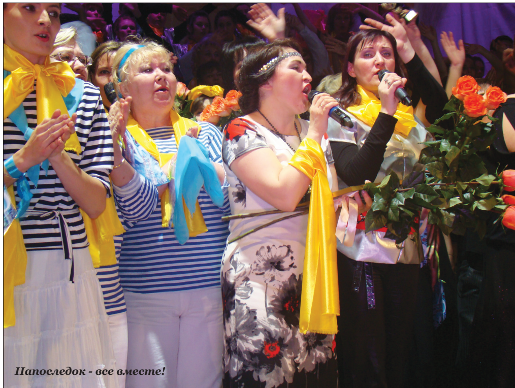
Напоследок - все вместе!