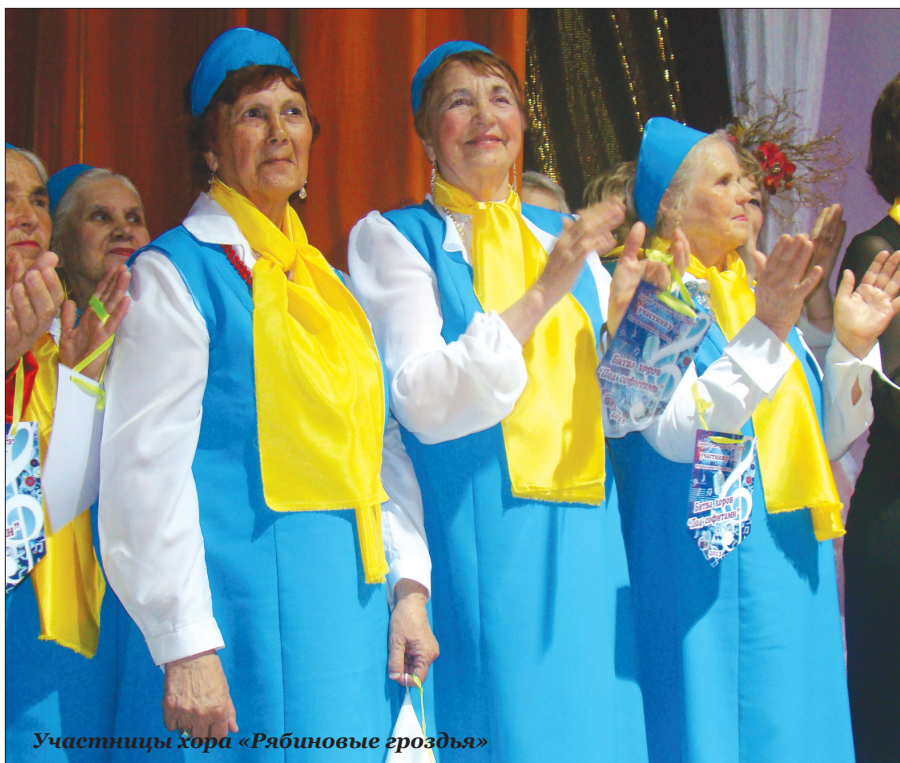
Участницы хора «Рябиновые гроздья»