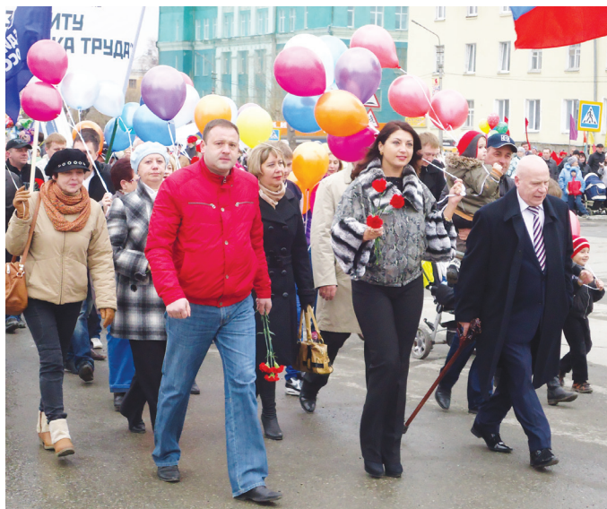
Одними из первых прошли депутаты городской Думы