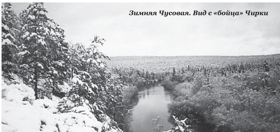
Зимняя Чусовая. Вид с «бойца» Чирки

Самой крупной рекой, протекающей по территории городского округа Первуральск, является Чусовая. Река уникальная. Вряд ли на планете найдется другая река с таким строптивым характером. Родившись на восточном склоне Уральского хребта, вопреки всем правилам, она рассекла горы и потекла на запад к своей «сестре» Каме. Чусовая прорезала горные кряжи, по берегам поднимаются крутые, высокие скалы. Вздрыбленные над водой на десятки метров каменные исполины, словно заколдованные нечистой силой знаменитые «бойцы», сторожат покой реки.