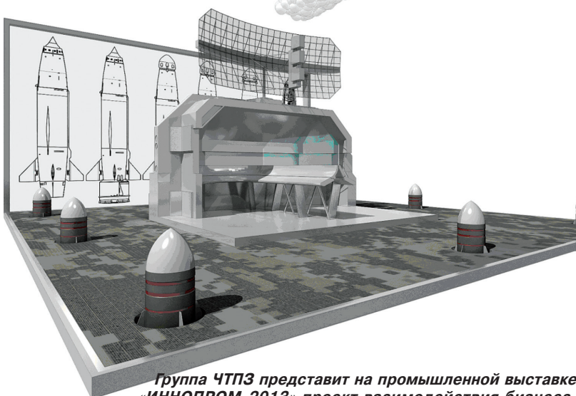
Группа ЧТПЗ представит на промышленной выставке «ИННОПРОМ-2013» проект взаимодействия бизнеса, общества и армии в рамках комплексной программы по подготовке рабочих кадров новой формации

Группа ЧТПЗ будет рада видеть у себя на стенде в рамках выставки «ИННОПРОМ-2013» всех желающих с 11 по 14 июля 2013 года, г. Екатеринбург, 3-й павильон.