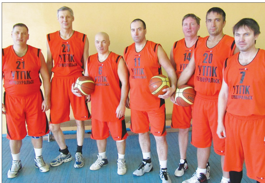
Сборная команда ветеранов города