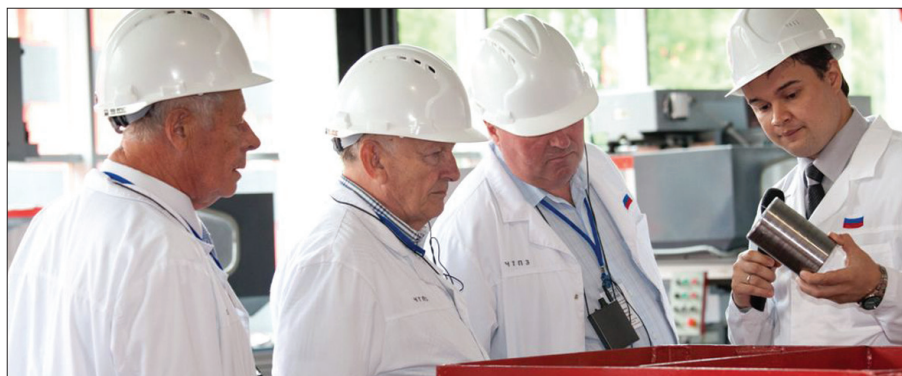
В Образовательном центре