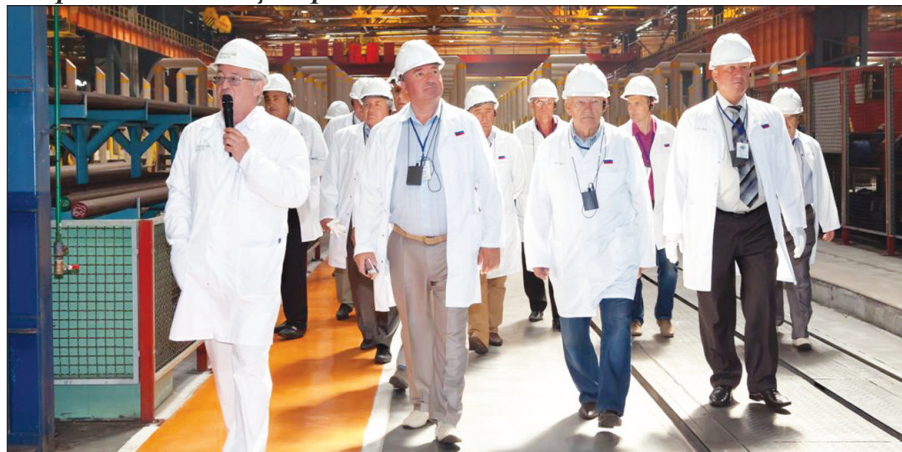
В Финишном центре ПНТЗ

Цель совещания лидеров профкомов трубных заводов стран СНГ – обмен опытом по вопросам взаимодействия внутри профсоюзных организаций. Участники обсудили способы мотивации и привлечения новых членов в первичные профсоюзные организации, укрепления своей роли и имиджа в рабочих коллективах.