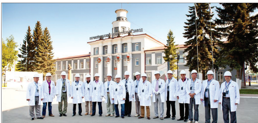
На территории ПНТЗ состоялся семинар-совещание председателей профкомов России, Украины и Белоруссии

На территории Первоуральского новотрубного завода состоялся международный семинар-совещание председателей профкомов первичных профсоюзных организаций, действующих на трубных предприятиях России, Украины и Белоруссии. Организатором встречи стало Международное объединение профсоюзов «Профцентр «Союзметалл».