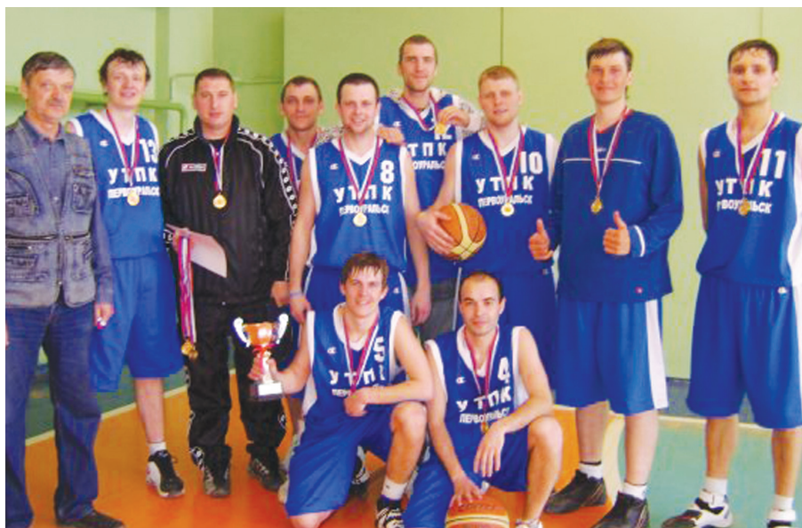
Сборная Первоуральска «УТПК» - чемпион первенства области 2008-2009 гг.

- Конечно, год (а он у баскетболистов по срокам совпадает с учебным годом) закончен с хорошими результатами. Баскетболистам есть чем гордиться. Особая благодарность школьным учителям физкультуры, которые культивируют баскетбол в своих школах. Без их активного участия невозможно представить первенство города среди учащихся разных возрастов. Но, конечно, наши результаты могли бы быть значительно лучше. Нормальному развитию баскетбола в городе препятствует недостаточное финансирование. В первоуральской ДЮСШ всего три тренера по баскетболу. Из-за этого число занимающихся этим видом спорта явно недостаточное. Желающих играть в баскетбол мальчишек и девчонок значительно больше. Данное обстоятельство отражается и на количестве побед на турнирах разных уровней. Существуют настоящие возрастные «провалы». Целые поколения молодых первоуральцев оказываются неохваченными занятиями баскетболом. Поэтому улучшение материальной базы баскетбола, появление новых тренеров – это задача уже не завтрашнего, а сегодняшнего дня.