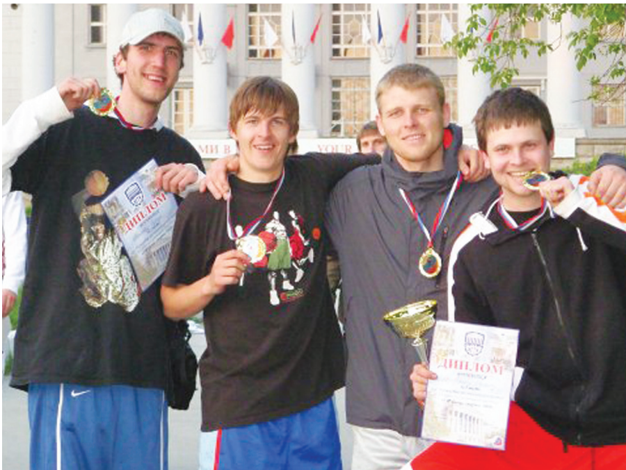
Команда «Шука» - чемпионы «Стритбол-УПИ-2008»

Первоуральские баскетболисты подводят итоги и строят планы на будущее