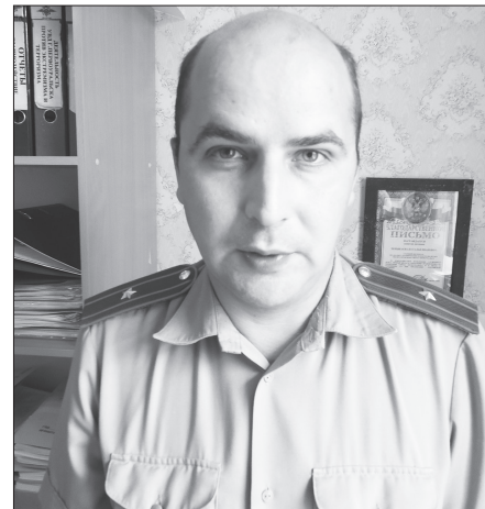
С 5 июля участковых в Первоуральске возглавляет майор полиции Сергей Валентинович Микрюков

По вопросам обращаться в отделение кадров ОМВД России по г. Первоуральску по адресу: ул. Ватутина, 21, каб. 203. Тел. 8 (3439) 27-05-45, 27-05-15.