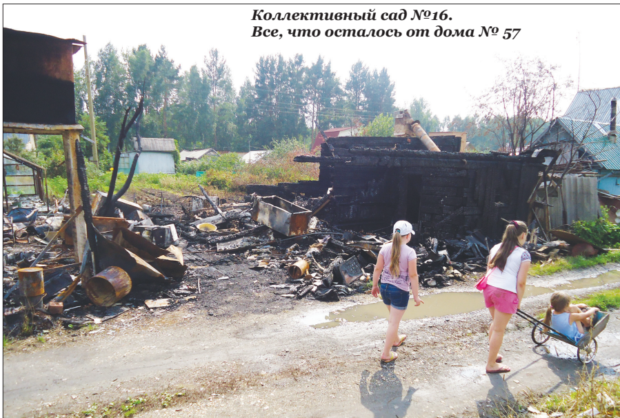
Коллективный сад №16. Все, что осталось от дома № 57

Все погибшие и травмированные – жители частного сектора или многоэтажек. 7 июля вспыхнула квартира в доме на ул. Шахтерской. Мужчину удалось вытащить из огня, но он скончался в больнице. 24 июля в коллективном саду № 16 сгорело два дома. Два человека получили ожоги и травмы: мужчина получил ожог руки, женщина, прыгая со второго этажа, сломала ногу, еще одна женщина - сгорела в доме. Предполагаемая причина пожара – застолье и неосторожное обращение с огнем.