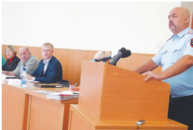
Павел Никифоров Фото автора

В итоге депутаты поручили временно исполняющему полномочия главы городского округа Андрею Рожкову в срок до 23 августа рассмотреть вопрос о предоставлении надлежащих помещений для организации участковых пунктов полиции и сообщить о принятом решении в городскую Думу до 26 августа. Также депутаты рекомендовали управлению ЖКХ согласовать с ОМВД годовой график уличного освещения.