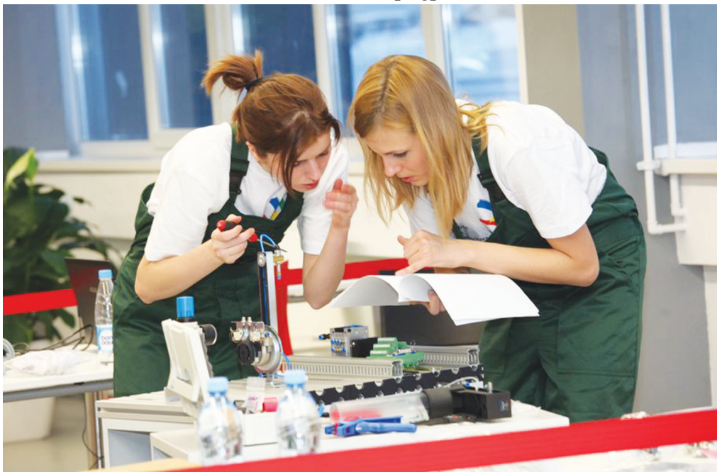
Образовательный центр компании ЧТПЗ оснащен самыми современными учебными тренажерами

Проект компании ЧТПЗ в области подготовки рабочих и специалистов для металлургической отрасли России, получивший название «Будущее белой металлургии», номинирован на престижную премию «HR-Бренд 2012». Организатором данной независимой ежегодной премии за наиболее успешную работу над репутацией компании как работодателя выступила группа компаний HeadHunter.