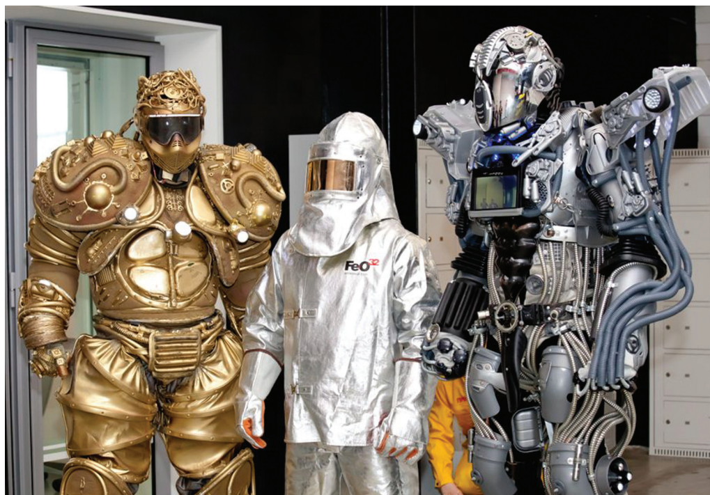
После междугалактического приветствия чемпиона роботы вышли на площадку для соревнований

- Я считаю, что успех первоуральской команды был запланирован и ожидаем. Приезжая сюда, мы видели, какие усилия прилагают завод и металлургический колледж для того, чтобы подготовить ребят. Победа команды Первоуральского металлургического колледжа - это результат огромной работы, это результат общей образованности студентов, профессиональных педагогических технологий, передовой материальной базы, созданной в