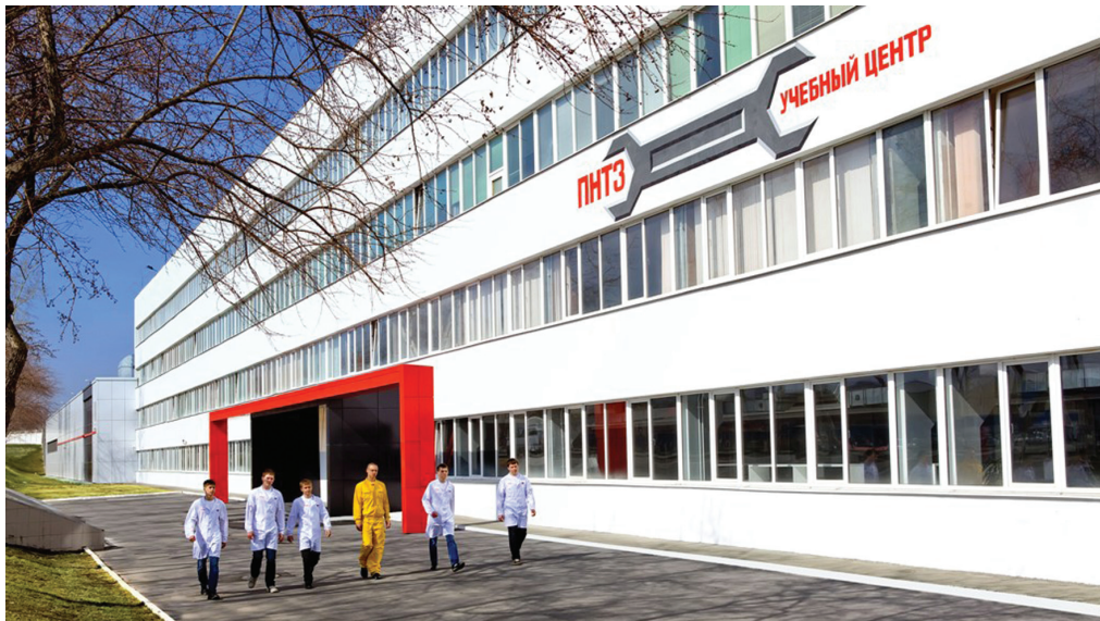
Будущее белой металлургии - образовательный проект компании ЧТПЗ

Первый в истории России чемпионат по мехатронике, проводившийся в нашем городе на базе учебного центра ЧТПЗ, завершился убедительной победой команды Первоуральского металлургического колледжа. Наша команда набрала 82 балла и оставила далеко позади соперников из Москвы, Санкт-Петербурга, Челябинской и Свердловской областей, ХМАО-Югры.