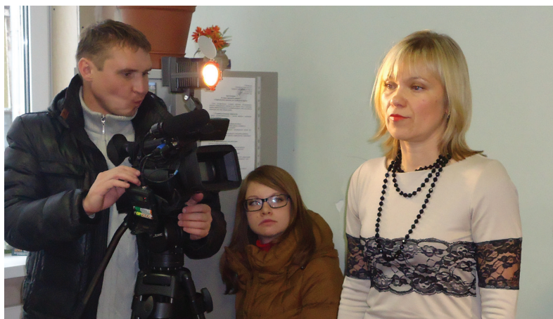
Павел Никифоров

Выслушав мнения сторон, суд принял решение и отказал бывшему директору школы в удовлетворении иска. Ошуркова намерена обжаловать решение в областном суде.