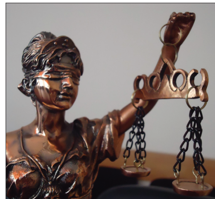
Павел Никифорова

Следующее заседание назначено на 26 ноября.