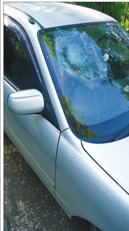
Павел Никифоров Фото автора

По данным фактам возбуждены уголовные дела по статье 158 УК РФ «кража».