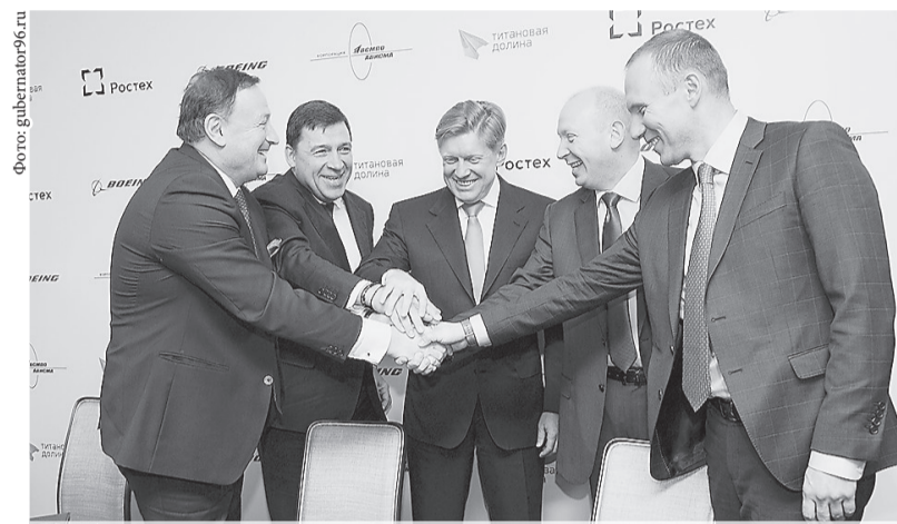
Губернатор Евгений Куйвашев на встрече с представителями бизнес-сообщества.

Губернатор дал органам власти региона два месяца на достижение первых результатов по выполнению «дорожной карты» по упрощению ведения бизнеса.