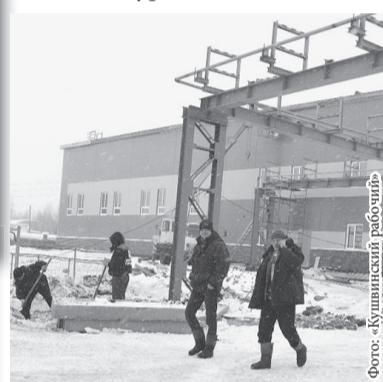
■ «Кушвинский рабочий»