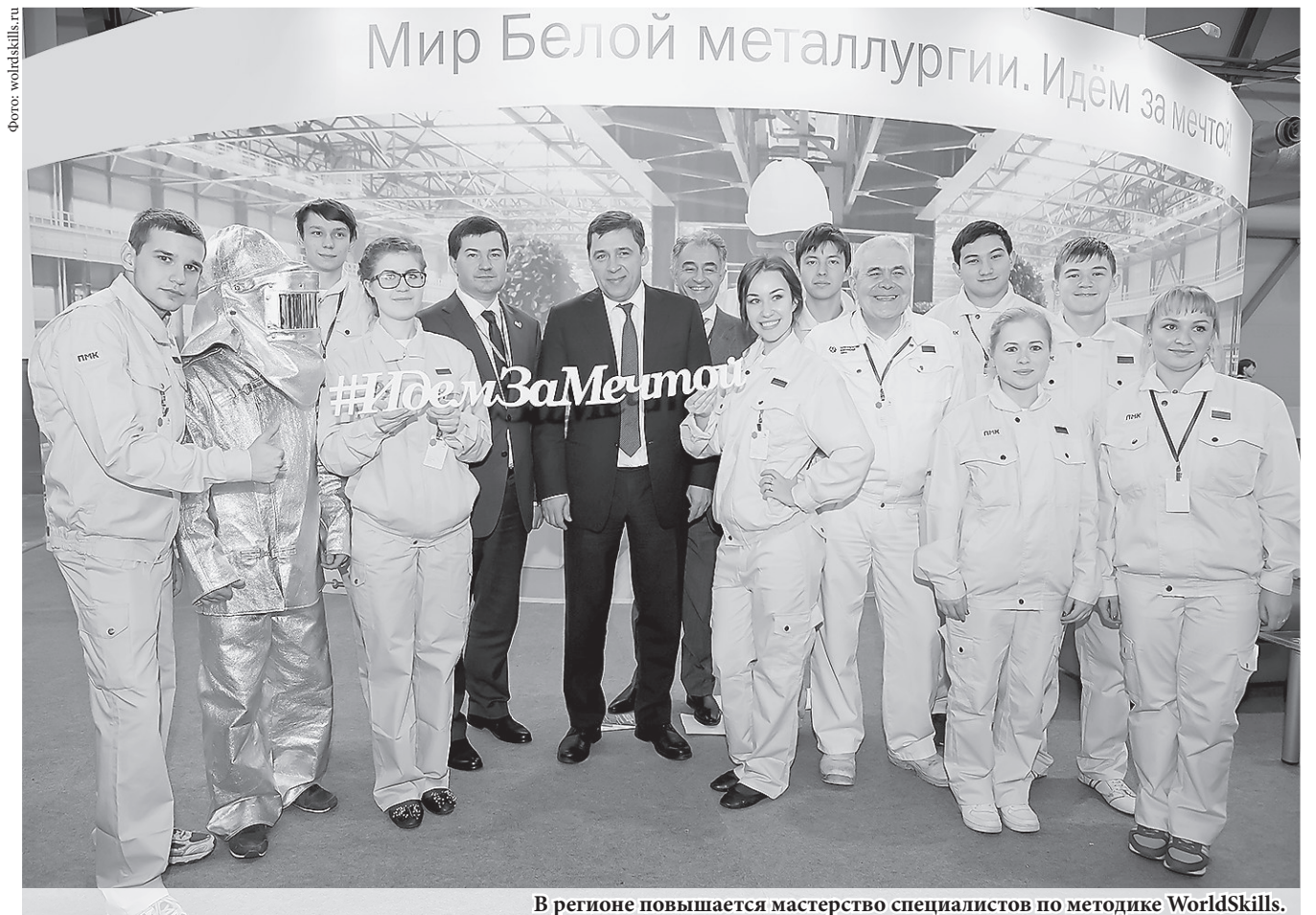
В регионе повышается мастерство специалистов по методике WorldSkills.

Один из резидентов технопарка – компания «НЕКСАН» планирует разместить высокотехнологичное производство промышленных теплообменников. Ещё один резидент – НПО «БиоМикроГели» – будет производить средства для очистки воды и твёрдых поверхностей от комплексных загрязнений, а также бытовую химию.