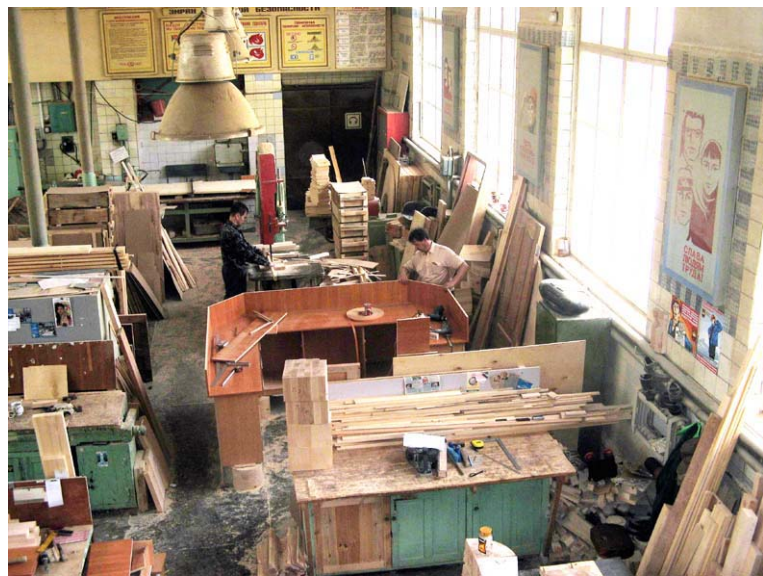
В столярной мастерской ремонтно-строительного управления.

На минувшей неделе на участке проводилось очередное обучение по пожарной безопасности. На случай форс-мажорных обстоятельств каждый должен четко выполнять свои задачи, знать, где расположены рубильники, чем тушить электрооборудование. На УЛиТе мы оформили специальный стенд, где пошаго-