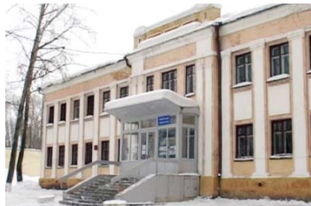
Избирательный участок № 2378

Дворец культуры «Огнеупорщик», г.Первоуральск, улица Ильича, 13. Телефон 27-83-87 .