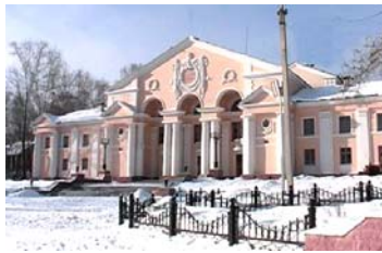
Избирательный участок № 2377

Муниципальное бюджетное общеобразовательное учреждение «Средняя общеобразовательная школа № 35», г.Первоуральск, улица 50 лет СССР, 11-а. Телефон 63-53-30 .