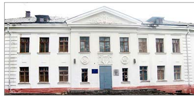
Отныне это два учебных корпуса одной школы.

ся почти до конца 2011 года. Процесс этот непростой, требовалось подготовить большой пакет документов, предполагалось множество согласований.