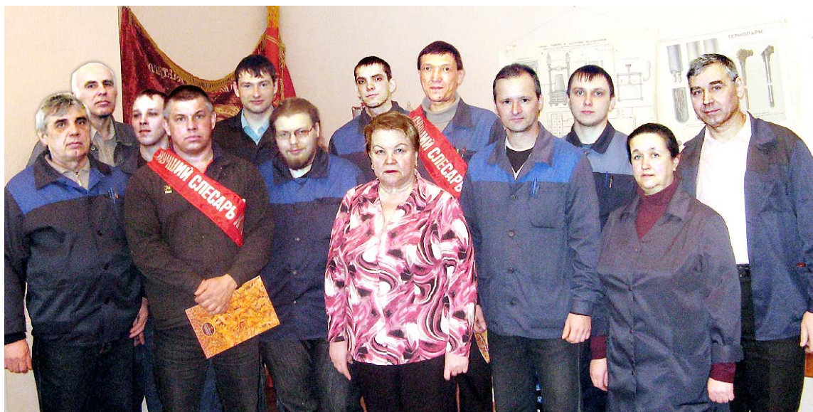
Участники мартовского конкурса профмастерства.