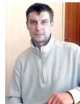
Александрович с удовольствием проводит с семьей: возит дочку на тренировки в секцию фигурного катания, делает уроки со старшим сыном. На вопрос об отдыхе напомнил анекдот: «Как ты расслабляешься?». - «А я не прагаюсь».