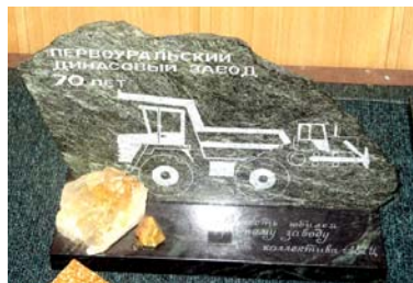
Завод чтоб процветал, прогресс был виден, И спорт гремел, и во Дворце пел хор!

Рудничане вручили двухкилограммовую стелу «40-миллионная тонна кварцита», созданную и отшлифованную Ю.Куриловым. Автотранспортники тоже подарили сувенир из камня – с гравировкой «В честь 70-летия завода от коллектива АТП» на фоне мощной турбины и отшлифованную Ю.Куриловым. Автотранспортники тоже подарили сувенир из камня – с гравировкой «В честь 70-летия завода от коллектива АТП» на фоне мощной турбины и отшлифованную Ю.Куриловым. Экономисты предприятия подготовили электронную презентацию с рапортом о своих достижениях: Мы рождены, чтоб сказочная прибыль Давала нам в развитии простор,