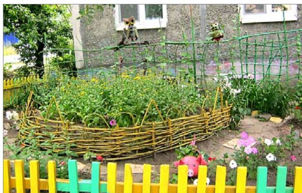
Дома микрорайона СТИ стоят практически рядом с лесом. То ли лесной воздух, то ли полевые цветы, то ли звонкоголосые птицы сподвигли жителей создавать под окнами красоту, подобную природной.