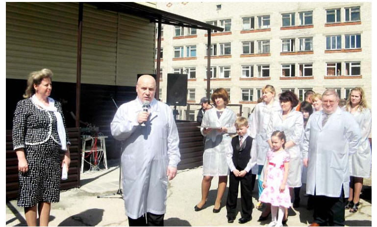
Со дня торжественного открытия после ремонта детской поликлиники прошло чуть больше трех месяцев.