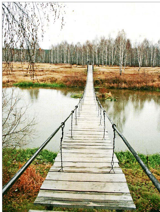
Фото из музея и архива редакции