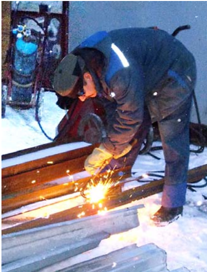
чем Фокиным по поводу работы строителей в очередные

субботу и воскресенье. И цеховикам хорошо, и монтажникам удастся сделать больше, когда оборудование остановлено. Действующее производство создаёт особые условия. Ремонт приходится вести, когда внизу работают станки, под фонарём передвигается мостовой кран. А строительная пыль не вызывает восторга у станочников, и оборудованию это не на пользу. Но обе стороны хорошо понимают, какую важную работу профинансировало руководство. Механический участок старается не выбиться из привычного ритма, а подрядчики используют выходные, чтобы ускорить выполнение заказа.