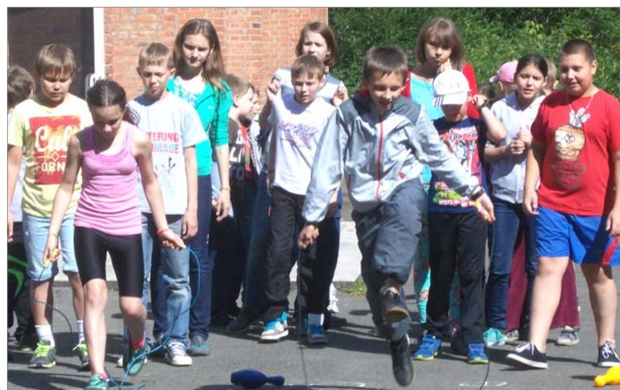
Старты были действительно весёлые.

В «Лесной сказке» началась третья оздоровительная смена. Снова звучат ребячьи голоса. Можно не сомневаться, и этот заезд будет веселым. Мальчишки и девчонки подругаются, наберутся сил и здоровья, ярких впечатлений. На планете с названием «Каникулы» скучать не приходится.