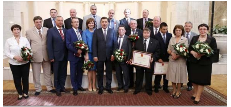
Награжденные с губернатором

Не первый раз присутствую на церемонии награждения государственными наградами Российской Федерации и знаками отличия Свердловской области. И всякий раз испытываю одно и то же чувство - гордость. Я живу в области, где много талантливых людей в разных сферах деятельности, где умеют ценить мастерство, профессионализм, вклад в общий результат опорного края Державы.